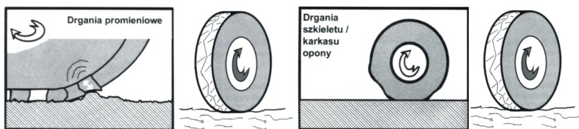
Rys. 4. Drgania promieniowe i styczne bieżnika opony przy ugięciu (po lewej) i drgania szkieletu opony (po prawej)

Źródła hałasu drogowego emitowanego przez poruszający się pojazd możemy podzielić na trzy zasadnicze grupy. Do pierwszej zaliczamy jednostkę napędową z współpracującymi podzespołami mechanicznymi pojazdu. Spalanie w silniku wywołuje największy poziom drgań i hałasu w zakresie 20 – 180 Hz. W podzespołach współpracujących z jednostką napędową (skrzynie biegów, reduktory, dyferencjały) źródłem zjawisk wibroakustycznych jest ruch obrotowy poszczególnych podzespołów. Drugą grupą jest hałas aerodynamiczny traktowany jako zjawiska akustyczne. Wynika on z opływu strug powietrza wokół nadwozia pojazdu, silnika i wentylatorów chłodzenia. Hałas aerodynamiczny cechuje się maksymalnymi wartościami częstotliwości w zakresie 2000 – 5000 Hz. Trzecim źródłem hałasu drogowego jest współpraca opon z nawierzchnią. Na poziom hałasu generowanego przez oponę decydujący wpływ ma konstrukcja i układ bieżnika. Zetknięcie się „klocka” bieżnika z nierównością nawierzchni wiąże się z powstaniem hałasu. Uderzenia takie powoduje drganie promieniowe i styczne bieżnika oraz warstw osnowy i opasania opony. Wizualizację powstawania drgań na styku opony z nawierzchnią przedstawiono na rysunku 4.