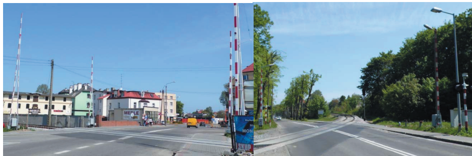
Rys. 3. Przejazd kat. A (po lewej) i przejazd kat. B (po prawej) na linii nr 213 Reda – Hel [10]

W myśl Rozporządzenia przejazdem kolejowo – drogowym jest skrzyżowanie, inne niż przejście. Przejściem określono skrzyżowanie w jednym poziomie przeznaczone wyłącznie dla ruchu pieszego, rowerowego lub pieszego i rowerowego. Dokumentem ustanawiającym klasyfikację i położenie przejazdów kolejowo – drogowych w Polsce jest Rozporządzenie Ministra Infrastruktury i Rozwoju z dnia 20 października 2015 r. w sprawie warunków technicznych, jakim powinny odpowiadać skrzyżowania linii kolejowych oraz bocznic kolejowych z drogami i ich usytuowanie [7].