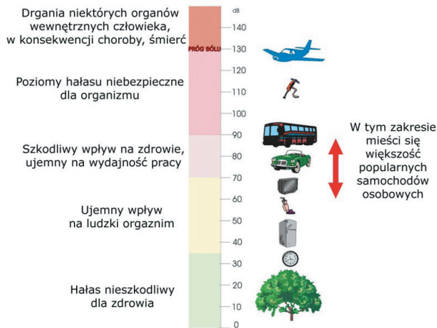
Rys. 1. Przykładowe wartości poziomów hałasu

Na co dzień jesteśmy narażeni na drgania i hałas pochodzący z różnych źródeł. W ośrodkach miejskich zjawiska wibroakustyczne potęgowane są poprzez układ transportowy miasta oraz przemysł. Rozwijająca się infrastruktura drogowa i kolejowa jest przyczyną powstawania większej ilości skrzyżowań typu tor – droga. Skrzyżowania te dla samochodów mogą być traktowane jako przeszkody poprzeczne. Ze względu na zróżnicowany stopień wyeksploatowania nawierzchni na przejazdach poruszanie się po niej może prowadzić do zwiększenia emisji nieprzyjanych dla środowiska dźwięków wynikających z uderzania opon w szyny kolejowe.