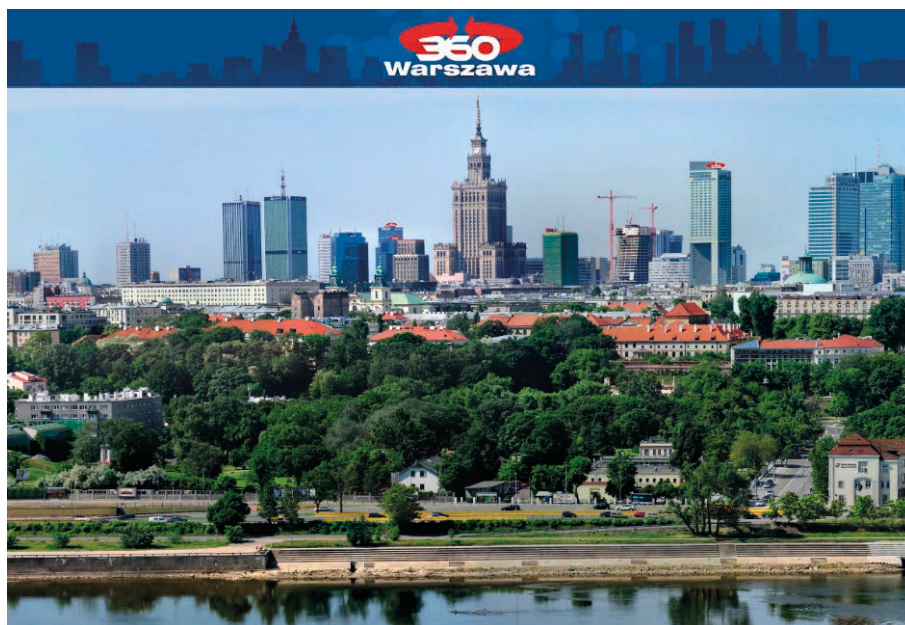
Rys. 1. Fragment panoramy Warszawy – Pałac Nauki i Kultury otoczony punktowcami