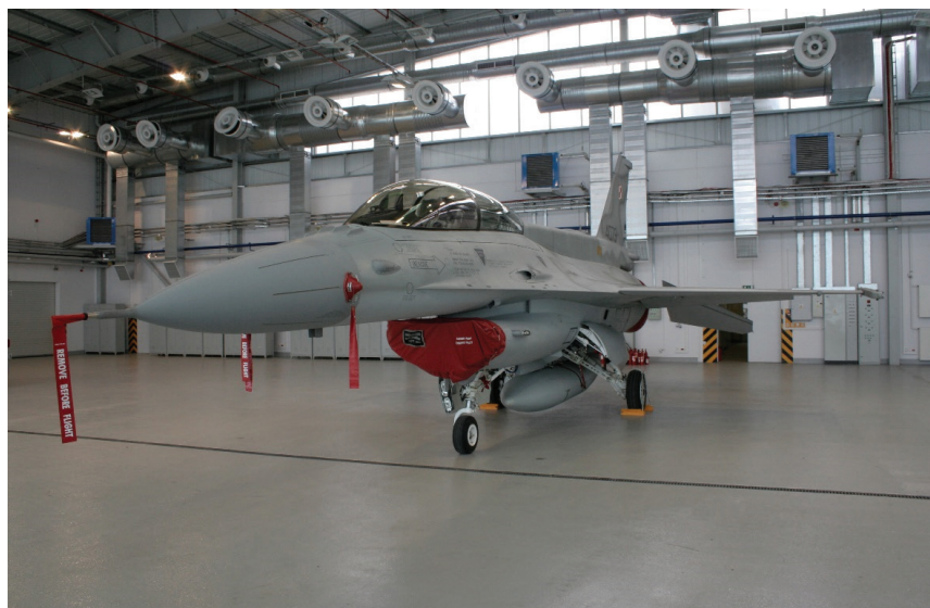
Fot. 1. Posadzka antyelektrostatyczna (na podstawie materiałów firmy Bautech)

Podstawowym kryterium klasyfikacji posadzek antyelektrostatycznych jest przewodność elektryczna. W europejskich i międzynarodowych dokumentach normatywnych przyjęto następującą klasyfikację posadzek (tab. 1): a) przewodzące, b) rozpra-