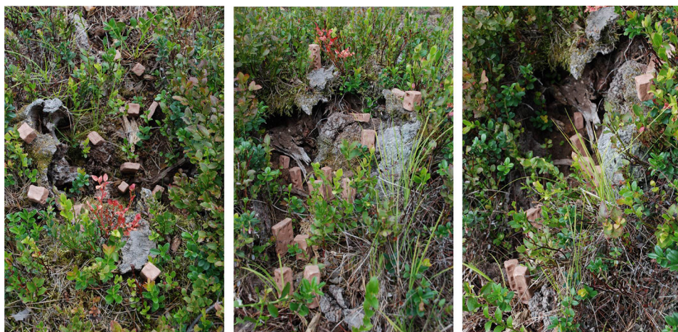
Ryc. 7. Wtopienie w otoczenie I Źródło: opracowanie własne.

Obiekty swoją skalą docelową musiałyby wyważyć proporcje część „zagłębionej” i wyniesionej ponad roślinność.