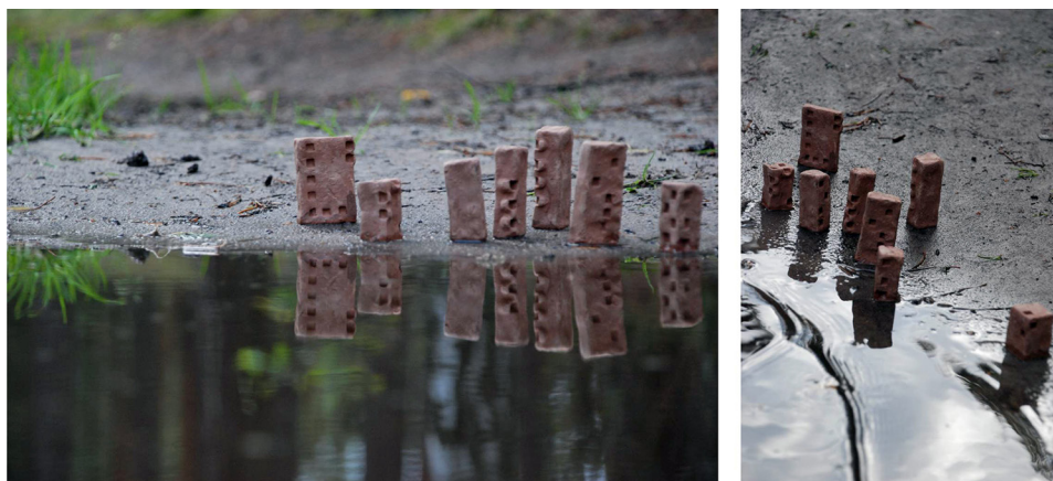
Ryc. 10. Badanie przestrzeni granicznych

Jako przykład eksploracji badawczo-twórczych przestrzeni granicznych można podać sprawdzanie lokowania na brzegu zbiornika wodnego, a nawet na skraju kałuży w lesie powstałej w wyniku obfitych opadów (ryc. 10–11).