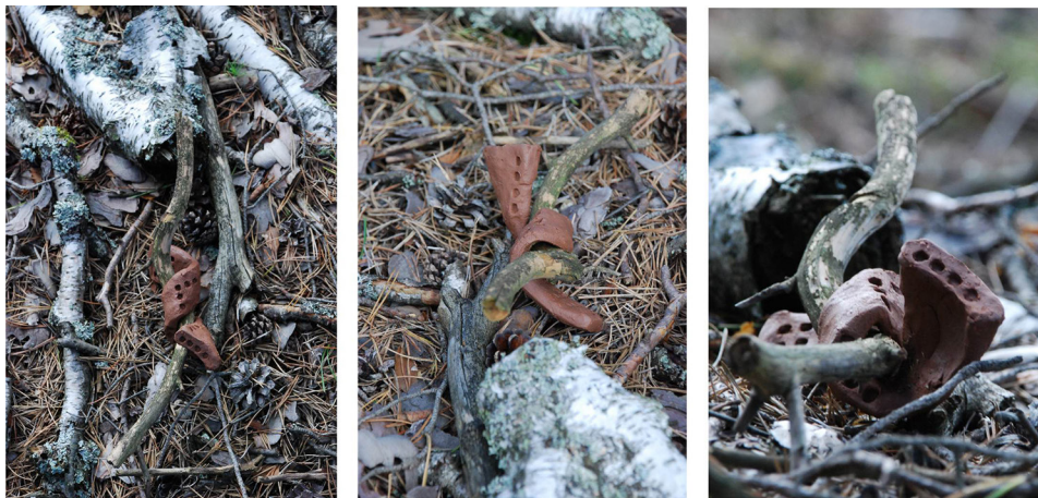
Ryc. 13. Rekompozycja z elementami biomorficznymi II

Autorskie rzeźby poszukują powinowactwa i źródła. Ukazują spasowanie, ale też niosą własną treść. Uzupełnione o przesłanie autorskie wnoszą wartości kulturowe, zmieniają wyraz i nastrój miejsca.