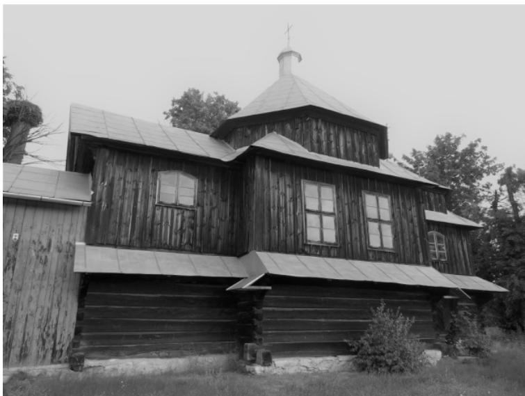
Rysunek 10. Cerkiew w Chotylubiu.