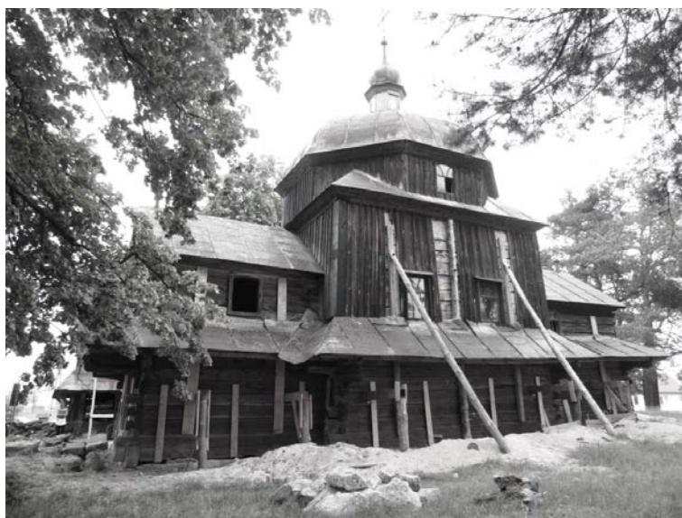
Rysunek 8. Remontowana cerkiew w Woli Wielkiej.

datkowo w trakcie wizytacji można także skontaktować się z lokalnym opiekunem obiektu, bądź też uzyskać informację kto jest zarządcą nieruchomości, pytając o to mieszkańców miejscowości. Część cerkwi nie jest już użytkowana jako świątynie i jest stale zamknięta. Są to obiekty trudno dostępne dla zwiedzających. Klucze do obiektu są u opiekuna albo w urzędzie gminy. W trakcie wizytacji można uzyskać informacje o dziejach danego obiektu. Osoby odpowiedzialne za udostępnianie danej cerkwi dla zainteresowanych, niejednokrotnie całe swoje życie spędziły w sąsiedztwie świątyni, stąd też są w stanie potwierdzić ilość i zakres ingerencji technicznych w strukturze obiektu, w ciągu ostatnich lat. Po wykonaniu wizji lokalnych liczba obiektów możliwych do zbadania zmalała z ośmiu do siedmiu.