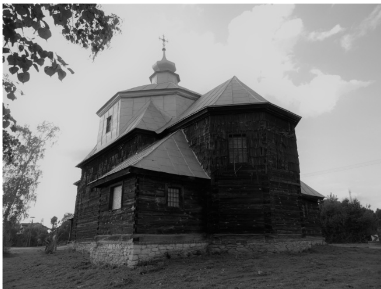
Rysunek 9. Cerkiew w Cewkowie.