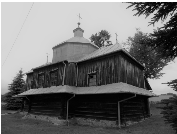
Rysunek 11. Cerkiew w Prusiu.