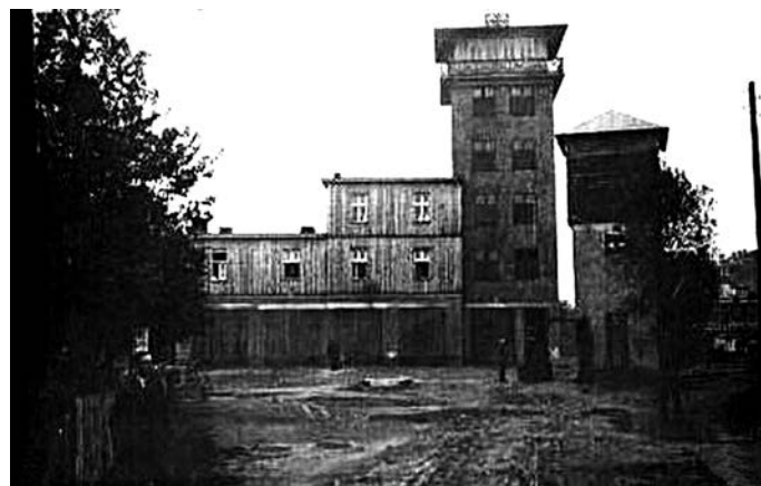
Rys. 4. Budynek stacji wodnej i strażnica Ochotniczej Straży Pożarnej 32

W I połowie 1928 roku pojawiła się nieoczekiwana okoliczność wykorzystania stacji wodnej do zaopatrzenia w wodę budynku prowizorycznej Strażnicy ogniowej 31 po wybudowaniu go obok stacji (rys. 4).