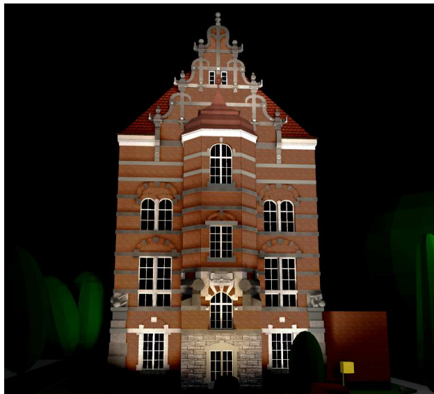
Rys. 6. Wizualizacja iluminacji z wykorzystaniem naświetlaczy umieszczonych na poziomie ziemi oraz na dwóch słupach

W wizualizacji przedstawionej na rysunku 6 zastosowano naświetlacze montowane na słupach w znacznej odległości od obiektu – oświetlają górną część elewacji, oraz naświetlacze umiejscowione w ziemi oświetlające od dołu niższe partie obiektu. Dzięki zastosowaniu naświetlaczy na słupach lepiej doświetlona jest górna część elewacji. Wykorzystanie światła mieszanego (lampy sodowe i metalohalogenkowe) zmienia nieco barwę elewacji na chłodniejszą.