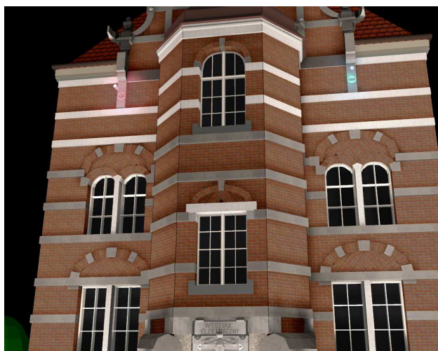
Rys. 7. Barwne wyeksponowanie znaków „+” i „-”

Rysunek 7 przedstawia barwne wyeksponowanie znaków „+” i „-” poprzez zastosowanie lokalnych naświetlaczy z filtrami barwnymi. Zastosowanie naświetlaczy o wyższej temperaturze barwowej niż w przypadku wizualizacji przedstawionej na rysunkach 5a i 5b pozwoliło uzyskać barwę elewacji zbliżoną do tej postrzeganej przy świetle dziennym (rys. 2).