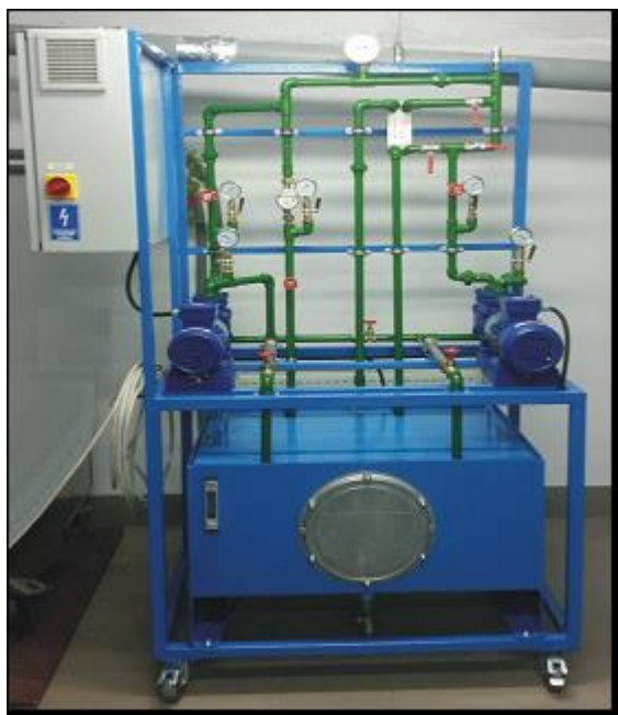
Rys.1. Widok ogólny stanowiska do badania warunków współpracy pomp wirowych.

pompowego dodatkowych (wymiennych) elementów przepływowych, o różnych charakterystykach struktury konstrukcyjnej (np. zawory z osadami zanieczyszczeń itp.), w celu prawidłowego rozpoznawania symptomów różnych stanów niezdatności eksploatacyjnej układu.