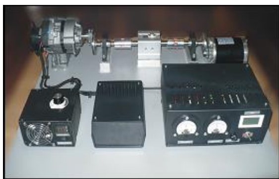
Rys. 2. Widok ogólny stanowiska do badania elektromechanicznego zespołu napędowego.

Stanowisko przeznaczone jest do celów dydaktycznych i pozwala przeprowadzić badania elektromechanicznego zespołu napędowego (rys. 2), ze szczególnym wyeksponowaniem pomiaru momentu skręcającego na wale napędowym.