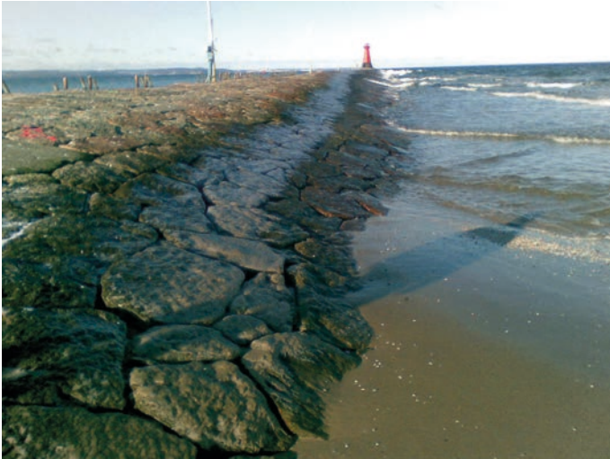
Rys. 3. Kamienna wykładzina falochronu przed przebudową