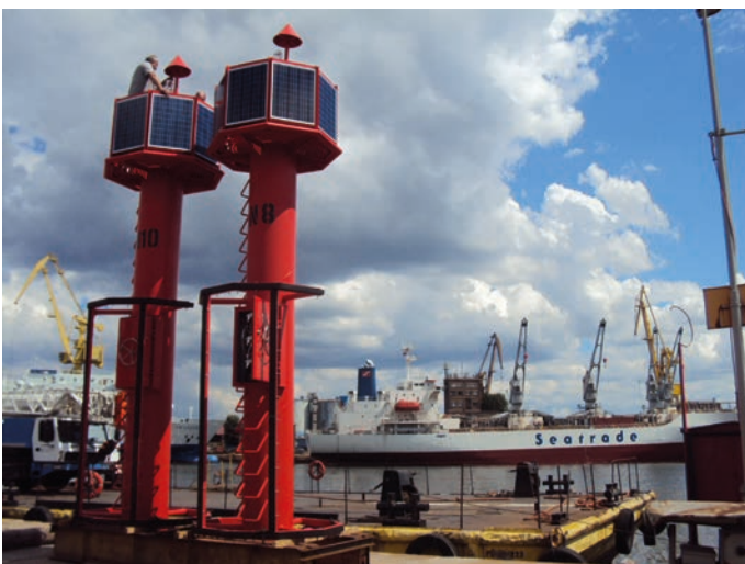
Rys. 14. Górna część pław torowych