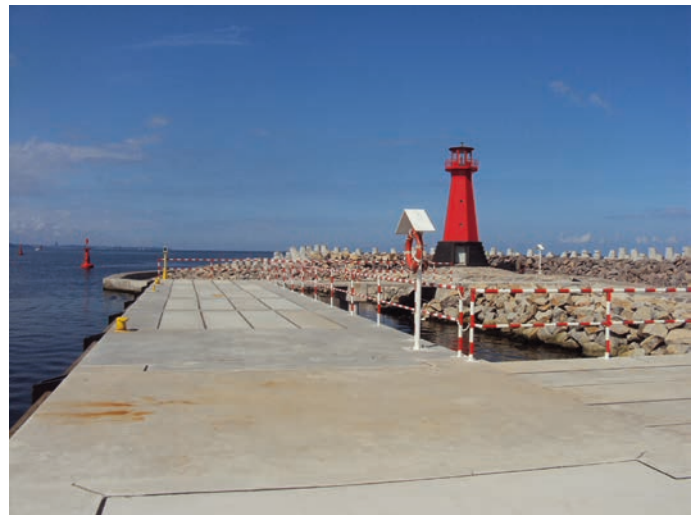
Rys. 16. Widok na nabrzeże serwisowe i głowicę