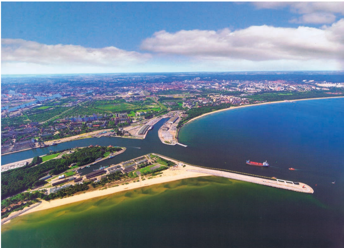
Rys. 1. Zdjęcie lotnicze na wejście do Portu Gdańskiego i Falochron Wschodni [6]