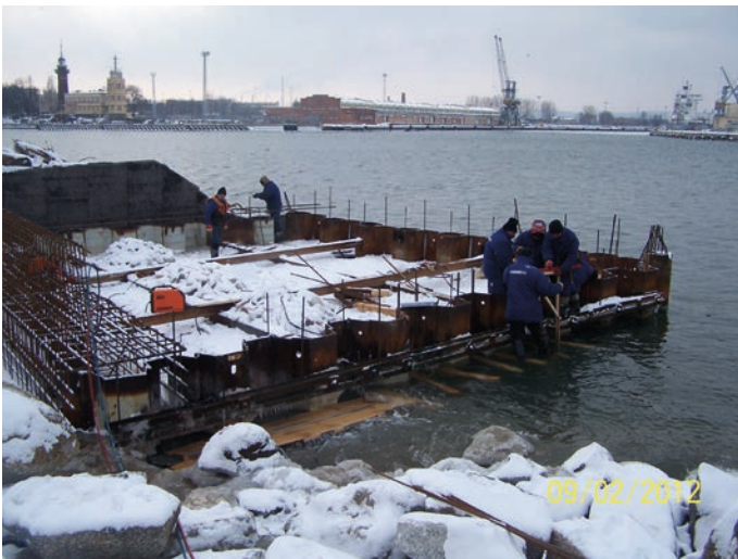
Rys. 13. Wykonywanie oczepu grodzdy u nasady falochronu