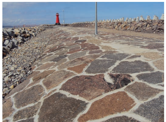
Rys. 17. Widok na wyremontowany dawny korpus