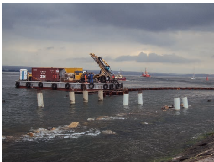
Rys. 11. Wykonywanie mikropali w części głowicowej