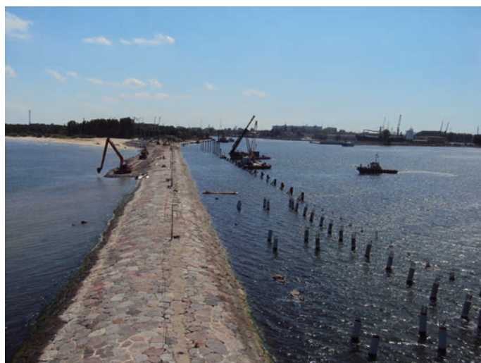
Rys. 10. Prace katarowe i nasypowe