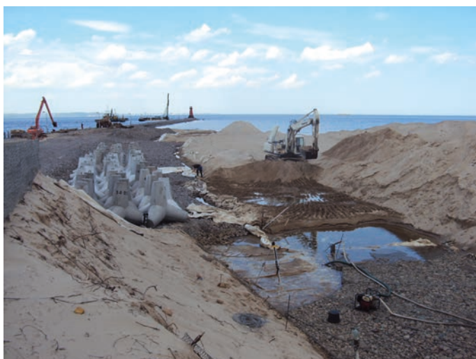
Rys. 8. Budowa umocnienia połączeniowego

Od strony północnej i wejścia do portu (od przyjętej osi istniejącego falochronu) w sektorze 130^\circ zaprojektowano ściankę szczelną wbitą w łuku (ścianka kombinowana HZ775C-12/AZ18). Na ścianie szczelnej wykonano żelbetowy oczep o rzędnej 0,92 m. Konstrukcję wzmocniono kotwami gruntowymi Titan 73/53 i koronką \phi 200 mm nachylonymi do poziomu pod kątem 35, 40 i 45 stopni (rys. 7).