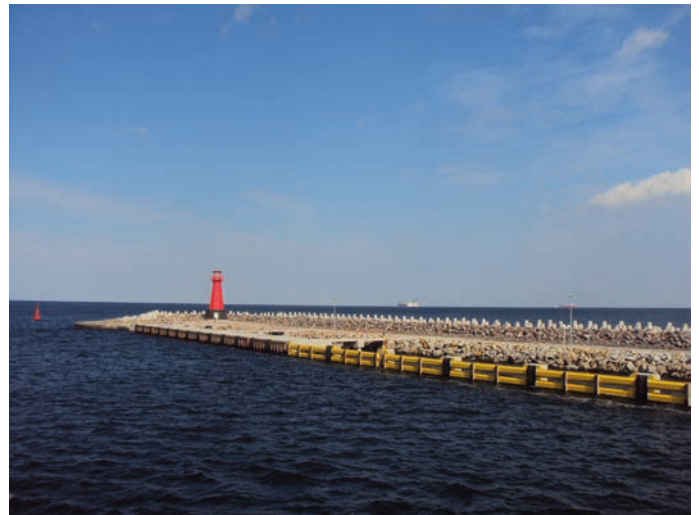
Rys. 15. Falochron po przebudowie