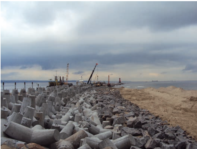
Rys. 12. Kolejne etapy prac