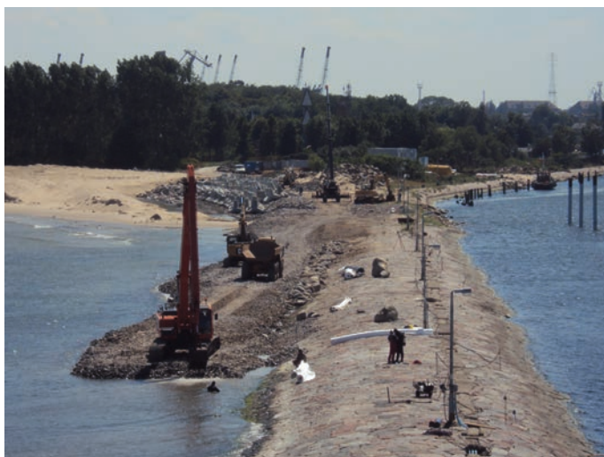
Rys. 9. Prace nasypowe