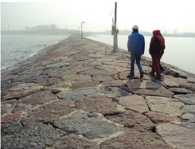
Rys. 4. Widok na konstrukcję wykładziny falochronu z XIX wieku

niółomu, lecz były zbierane na okolicznych polach kaszubskich czy żwirowniach. Była to tytaniczna praca jak na ówczesne możliwości techniczne. Do dzisiaj podziwiać możemy tę „cyklopową” budowlę, gdyż przebudowę zaprojektowano tak, że omawiana efektowna i zabytkowa konstrukcja pozostaje widoczna. Od strony Toru Wejściowego stateczność skarpy poprawiała palisada z pali drewnianych. W tym miejscu z czasem powstał również drewniany pomost komunikacyjno-spacerowy.