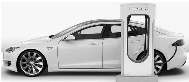
Rys. 1. Samochód Tesla S P100D podłączony do szybkiej ładowarki Supercharger [9]

ładowania. Doładowanie kolejnych 20% pojemności elektrycznej może zajmować nawet tyle samo czasu co pierwsze 80% pojemności, dlatego jest nawet zalecane, aby przerywać ładowanie po osiągnięciu 80%. Na osobną uwagę zasługują rozwiązania największego chińskiego producenta pojazdów EV/PHEV firmy BYD. Oferują oni systemy szybkiego ładowania napięciem przemiennym o mocy 40 kW. Ich ładowarki również od początku przewidują dwukierunkowy przepływ energii, co nie było możliwe w pierwszych rozwiązaniach standardu CHAdeMO.