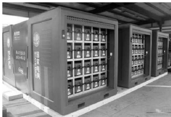
Rys. 2. Demonstracyjna stacja wymiany baterii akumulatorów firmy HEPSTD w Chinach [18]

Ostatnim systemem uzupełnienia zasobników energii w pojazdach EV/PHEV jest całkowita wymiana baterii akumulatorów, z ang. battery swap . Na rysunku 2 przedstawiono demonstracyjną stację wymiany baterii akumulatorów eksploatowanej w Chinach. Koszt utworzenia odpowiednich stacji wymiany akumulatorów oraz infrastruktury jest duży, ale czas potrzebny na wymianę baterii to ok. 2 min [18]. Dodatkową zaletą takiego