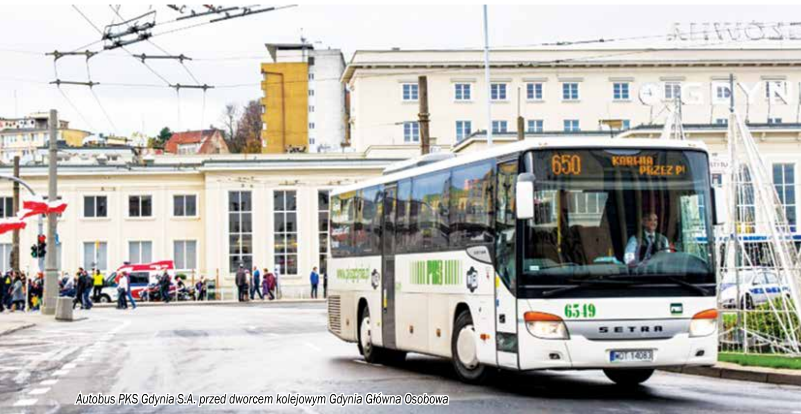
Autobus PKS Gdynia S.A. przed dworcem kolejowym Gdynia Główna Osobowa