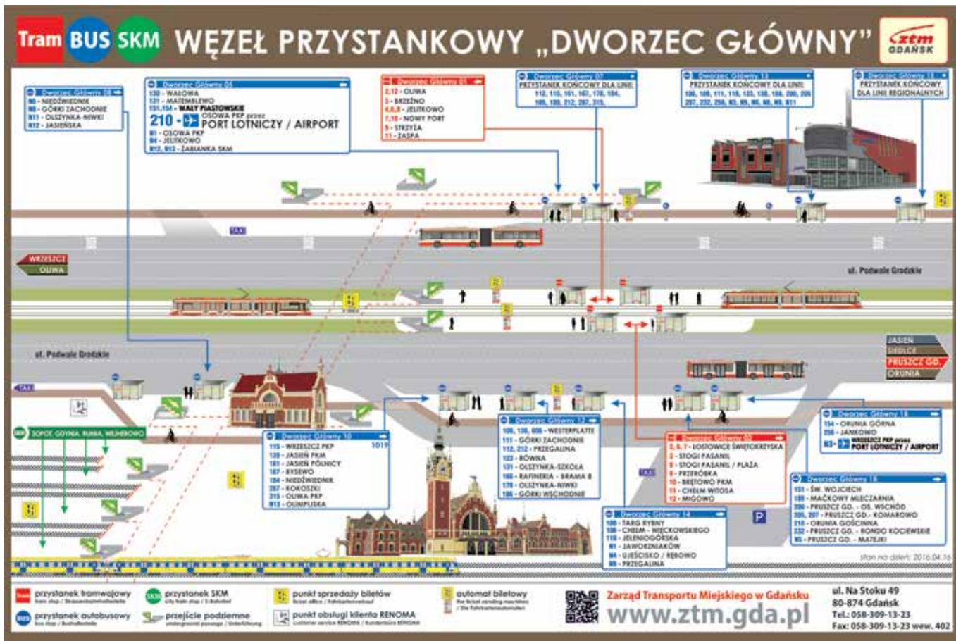
Rys. 2. Wizualizacja węzła przesiadkowego Gdańsk Główny

transportu. Wprowadzenie wspólnego biletu na usługi transportu publicznego o atrakcyjnej dla pasażera cenie może spowodować zmniejszenie przychodów ze sprzedaży biletów u operatorów honorujących takie bilety. Stąd też może zaistnieć konieczność zwiększenia poziomu dofinansowania usług przewozowych w związku z wprowadzeniem integracji biletowej, o ile spadek przychodów nie zostanie wyrównany wzrostem popytu na zintegrowane usługi.