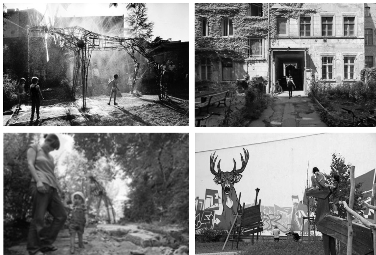
Fot. 16-19. Hirschhof przy Kastanienallee, Berlin, Prenzlauer Berg