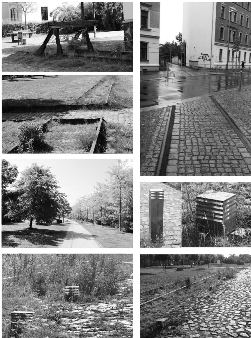
Fot. 27-34. Wykorzystanie autentycznych elementów wyposażenia terenu przekształcanego z bocznic i placów kolejowych w przestrzenie publiczne – parki, place, ścieżki piesze – zapewniają poczucie autentyczności przestrzeni i historycznej ciągłości miasta