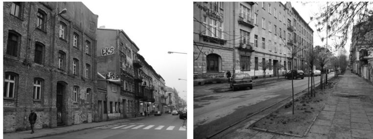
Fot. 1. i 2. Ulice Łodzi w rejonie projektów rewitalizacyjnych