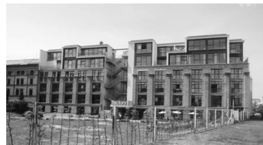
Fot. 13. Dawna fabryka lodu, dziś centrum przemysłów kreatywnych Factory Berlin HQ, Rheinsberger Straße, Berlin, Prenzlauer Berg