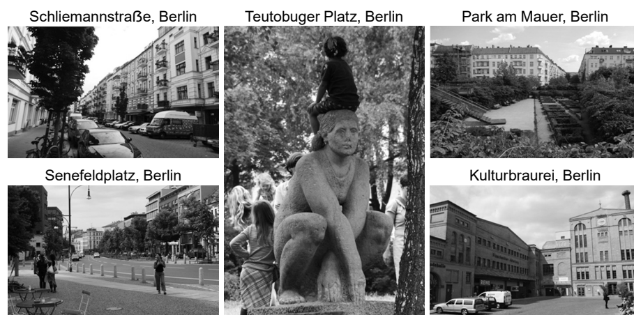
Fot. 7-11. Charakterystyczne widoki zrewitalizowanej berlińskiej dzielnicy Prenzlauer Berg

Analiza rewitalizacji 4 głównych obszarów dzielnicy Pankow, w rejonie Prenzlauer Berg, to atlas rozwiązań przestrzenno-organizacyjnych, które posłużyć mogą Łodzi w rozwoju jej polityki rewitalizacji, znajdującej się na pierwszym etapie realizacyjnym – podstawowych remontów obiektów gminnych oraz formułowania zasad efektywnej współpracy ze społecznością lokalną w tym procesie. W tym punkcie rozwojowym, Berlin znajdował się w pierwszej połowie lat 90, doświadczając pierwszej fali zmiany profilu ludności. Wielu spośród rdzennych, aktywnych mieszkańców (głównie rodziny) wyprowadzało się ze zrujnowanych mieszkań komunalnych do miast zachodnich landów lub korzystając z tanich, wspieranych kredytów, osiedlało się na suburbiach Berlina. Pustostany Prenzlauer Bergu zasiedlali młodzi Niemcy (etnicznie), najczęściej studenci, którzy w następnym dziesięcioleciu stworzyli nową miejską klasę średnią: