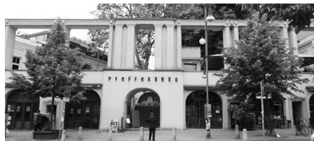
Fot. 14. Dawny browar przy Senefelderplatz, obecnie centrum przemysłów kreatywnych Pfefferberg [ www.pfefferberg.de ], Berlin, Prenzlauer Berg

Strategia rewitalizacji otworzyła możliwość realizacji w dzielnicy nowych obiektów mieszkaniowych i mieszkaniowo-biurowych. Obowiązującym w Niemczech założeniem jest, aby nowe obiekty budowane były w stylu współczesnym respektującym historyczne otoczenie. Również na Prenzlauer Bergu przyjęto to założenie inkorporując często w nowych budynkach historyczne pozostałości, unika się kopiowania przeszłości oraz stylistyki pastisz – historyzowania rozwiązań architektonicznych. Ostatnia dekada uczyniła z dzielnicy społeczny tzw. dobry adres, podnosząc popyt na nowe, solidniej zbudowane i nowoczesnie rozplanowane budynki mieszkalne. Od kilku lat realizowany jest również w Berlinie program wsparcia dla realizacji mieszkalnictwa dostępnego przez nowy model finansowo-organizacyjny tzw. Bau-