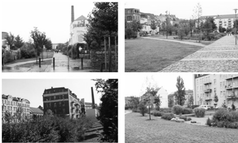
Fot. 23-26. Henriettenpark z widokiem na adaptowany na funkcje cohousing ośrodka „Nest”, Leipziger Westen

Realizacja głównych zamierzeń określonych w planie koncepcyjnym w 2002 r. przynosi powoli efekt – ponownego wypełniania się zabudowy. Dużą zasługę miało przewartościowanie przyzwyczajęń do logiki rządzącej miastem