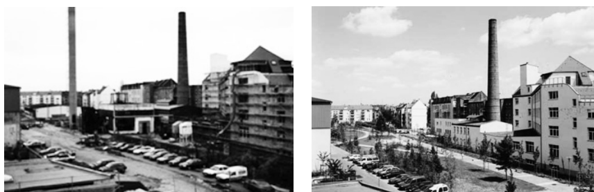
Fot. 21 i 22. Henriettenpark przed i po rewitalizacji

Efekt katalizy urbanistycznej, jaką wywołała transformacja rampy kolejowej na Henriettenpark w dzielnicy Lindenau należy obecnie do klasyki warsztatu rewitalizacji ukształtowanego transformacją gorlickiego dworca kolejowego na berlińskim Kreuzbergu w Gorklitzer Park – obecnie największą przestrzeń otwartą tej intensywnie zabudowanej i gęsto zaludnionej dzielnicy robotniczej Berlina. Podobne zamierzenie – poprawy parametrów lokali-