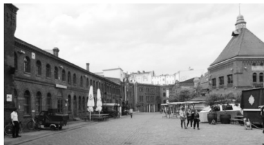
Fot. 12. Dawny browar przy Schonhauser Allee, obecnie centrum kulturalno-rozrywkowe, KulturBrauerei [ www.kulturbrauerei.de ], Berlin, Prenzlauer Berg

Rewitalizacja Prenzlauerbergu pozwoliła na wyeksponowanie i utrwalenie śladów przedwojennej berlińskiej tradycji kultury żydowskiej. Cmentarz Jüdischer Friedhof Schönhauser Allee oraz synagoga przy Rykestraße znajdują się na mapach tej istotnej części dziedzictwa miasta. Przedwojenną i powojenną zło-