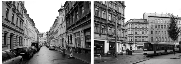
Fot. 3. i 4. Ulice Lipska w rejonie rewitalizacji Plagwitz

proces odnowy w 7 nowych obszarach rewitalizacji w dzielnicach Mitte, Neukölln, Friedrichshain-Kreuzberg, Lichtenberg i Spandau. Miasto chce na ten cel przeznaczyć ok. 200 mln €, angażując w swoją politykę środki unijne, jak i ponad 2-3 krotnie większy budżet środków prywatnych przez zróżnicowane formy partnerstwa.