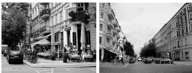
Fot. 5. i 6. Ulice Berlina w rejonie rewitalizacji Prenzlauer Berg, Kollwitzplatz

W realizacji strategii rewitalizacyjnych Berlin rozpoznał swoją szansę na zbudowanie nowego wizerunku – z szarego, urzędniczego miasta konfliktu, stał się miastem kreatywnym, oferującym talentom wszechstronny rozwój