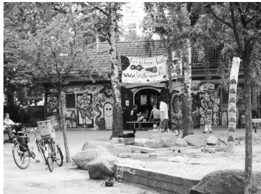
Fot. 15. Platzhaus – domek parkowy na Teutoburger Platz

ta budynku kontynuuje tradycje kulturalne z początku lat 90. i jest niezbędna dla funkcjonowania niezależnej artystycznej sceny alternatywnej 20 .