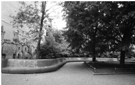
Fot. 20. Trwałe i tymczasowe zagospodarowanie pustych działek na parki kieszonkowe, Berlin, Prenzlauer Berg

nia się miasta. To połączenie pozwoliło na wygenerowanie środków publicznych na rzecz wsparcia działań integrujących społeczność w działaniach ku poszerzeniu i utrzymaniu powierzchni biologicznie czynnej, retencjonującej wodę deszczową. Zarząd dzielnicy Pankow uruchomił, na wniosek inicjatyw lokalnego NGO ( Die Grüne Liga Berlin ), konkurs pt.: 100 Hofe (100 podwórek), Temat zazieleniania nieużytków miejskich, a tym bardziej udostępniania ich choćby