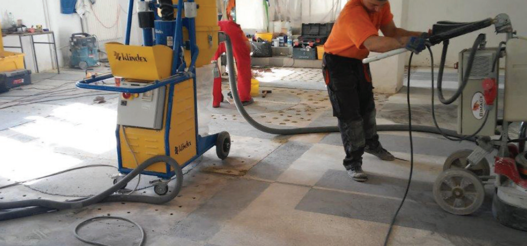
Fot. 3. Wstępne szlifowanie nawierzchni posadzki typu lastrico [M1]