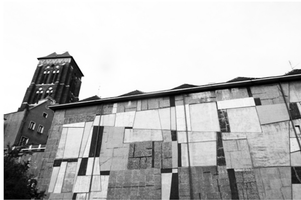
Fot. 2. Mozaika Anny Fiszer (fragment)