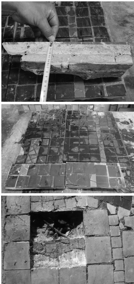
Fot. 6-8. Ekspertyza mozaiki Anny Fiszer (fot. 6-8).

została) została przymocowana do ściany punktowo za pomocą długich gwoździ wbitych w spoinę muru [Wilde et al. 2015] (fot. 6-8).