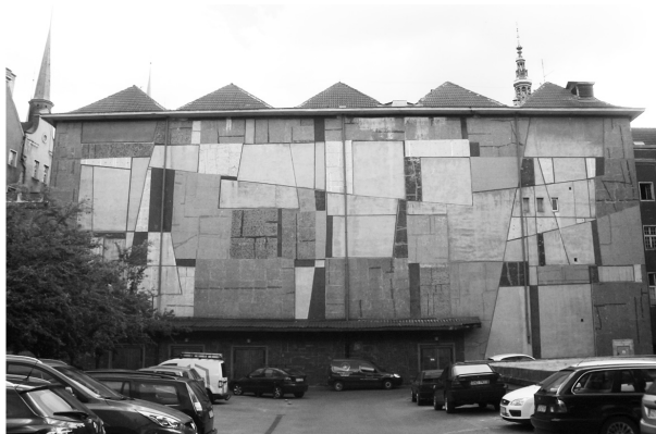
Fot. 1. Mozaika Anny Fiszer