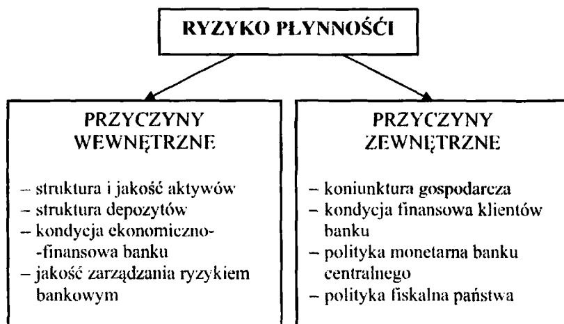
Rys. 1. Przyczyny ryzyka płynności

Ryzyko płynności determinowane jest przez czynniki o charakterze wewnętrznym i zewnętrznym 3 , które przedstawiono na rysunku 1.