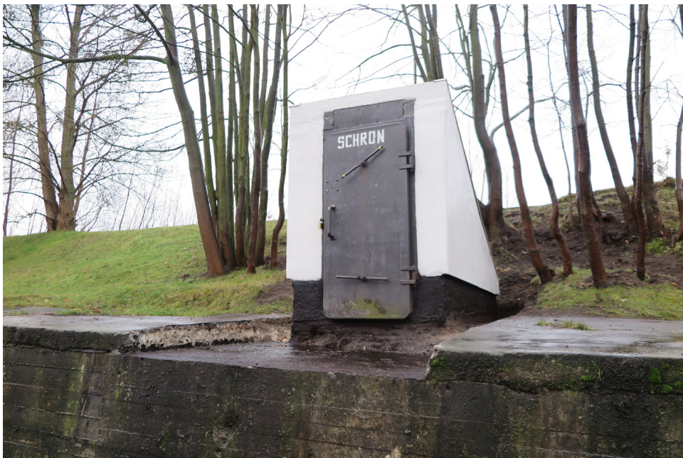
Ryc. 3 Schron przy ul. Morskiej w Gdyni Leszczynkach, po rewaloryzacji przez Gdyński Klub Eksploracji Podziemnej

Ważną i specjalistyczną aktywnością wyróżnia się Gdyński Klub Eksploracji Podziemnej , stowarzyszenie założone w 2007 r. i skupiające swoją działalność na zabytkach powojaskowych 22 . Zajmuje się m.in dokumentowaniem (w tym dla MKZ) i inicjowaniem ochrony zabytków militarnych na terenie Gdyni. Ponadto GKEP kilka lat temu przeprowadził społecznie niełatwą rewaloryzację schronu przeciwlotniczego z czasów II wojny światowej przy ul. Morskiej w Gdyni-Leszczynkach, w którym urządził swoją siedzibę (Ryc. 3-4). GKEP zajmuje się ponadto popularyzacją i edukacją poprzez np. organizowanie zwiedzania schronu z jego bardzo interesującą ekspozycją pamiątek powojaskowych 23 .