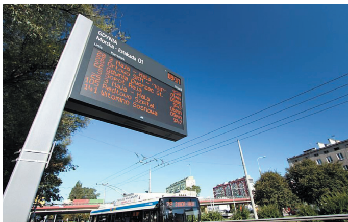
Rys. 2. Elektroniczna informacja informująca o rzeczywistych czasach odjazdów

Budowa lub wydzielanie buspasów zostały przyjęte jako standardy do realizacji w 13 miastach. Elektroniczny rozkład jazdy dla kierowcy za standard uznawany jest w 11