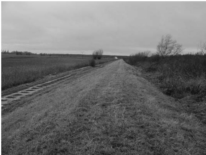
Rys. 1. Widok nasypu na polderze 76 w miejscowości Nowe Dolno zmodernizowanego z zastosowaniem metody zagęszczania udarowego po 13 latach eksploatacji budowli

W drugim etapie, po rozbudowaniu i podwyższeniu nasypu wybito kinetę w nadbudowanej części metodą udarową, wykonując rdzeń szczelny, którego oś pokrywała się z osią rdzenia w starym nasypie.