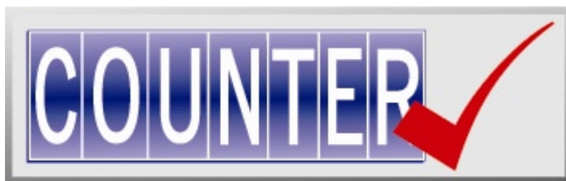
Rys. 1. Grafika na stronie wydawcy oznacza, że raporty przez niego dostarczane są zgodne ze standardem COUNTER

Czym właściwie jest Code of Practice? Jest to zbiór zasad, według których wydawcy, którzy pragną zachować zgodność ze standardem COUNTER, muszą gromadzić i udostępniać statystyki użytkownikom. Edycja 4 obejmuje 23 schematy raportów. 8 z nich dotyczy statystyk e-czasopism, 3 – baz danych, 5 – książek elektronicznych, 2 – plików multimedialnych, natomiast pozostałe 5 zawiera zbiorcze statystyki dla wszystkich dokumentów udostępnianych na danej platformie. Tabela nr 1 przedstawia wszystkie rodzaje raportów oraz ich opisy.