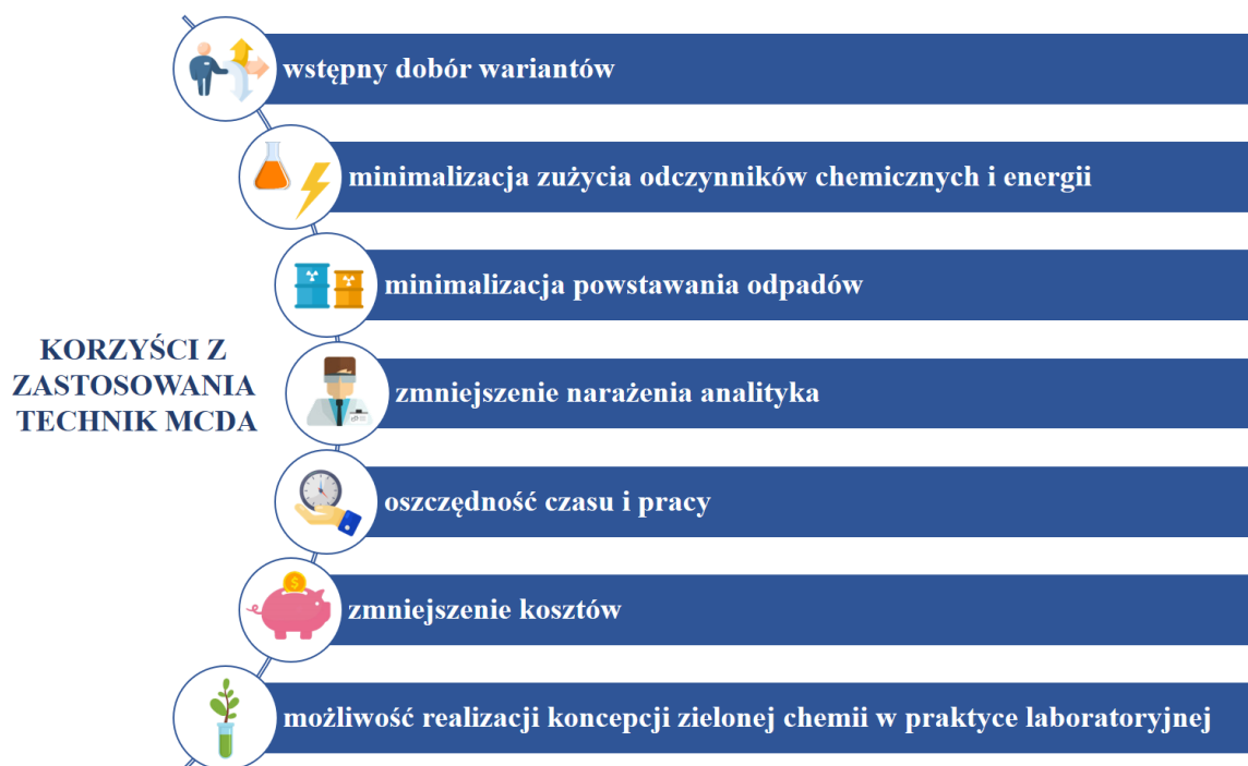
192 193 Rys. 4. Korzyści związane ze stosowaniem technik MCDA jako narzędzi wspomagających 194 etap przygotowania próbek do analizy

189 odczynników chemicznych, oszczędzając czas i pracę, a także zmniejszając narażenie 190 analityków. Korzyści wynikające z zastosowania technik MCDA na etapie przygotowania 191 próbek do analizy przedstawiono na Rysunku 4.