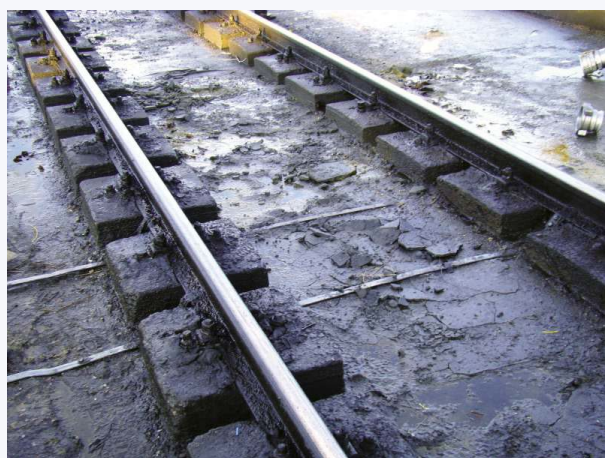
FOT. 2. Tor z płytą podtorza: uszkodzenia części głównej podtorza

W wykonanych odkrywkach stwierdzono gromadzenie się pod płytą podtorza cieczy ropopochodnych (przez ich napływanie) pochodzących z rozładunku cystern kolejowych ( FOT. 3 ).