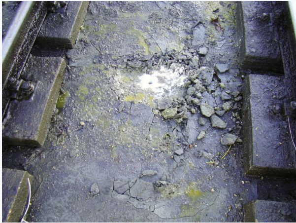
FOT. 5. Tor z płytą podtorza: odkrywka – otwór kontrolny; fot. archiwum autorów.