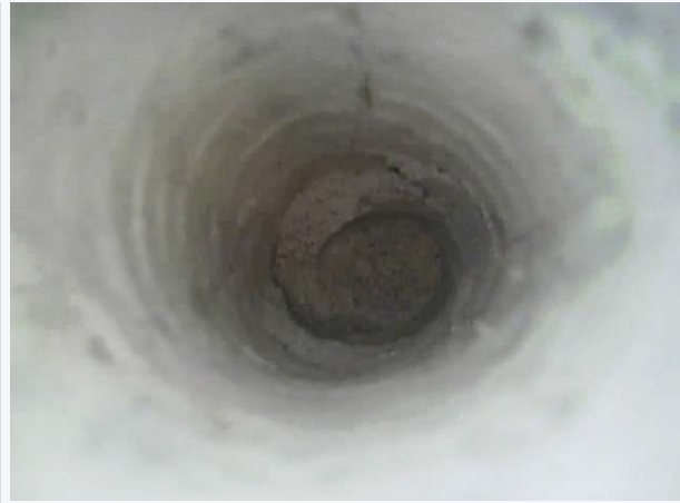
FOT. 6. Tor z płytą podtorza: wnętrze otworu kontrolnego; fot. archiwum autorów.

Bezpośrednią przyczyną występujących uszkodzeń żelbetowej konstrukcji podtorza, w tym warstwy zaprawy naprawczej PCC, była niska jakość wykonanych robót oraz zastosowanie materiałów niekompatybilnych do agresywnego środowiska eksploatacji (czynnikami oddziaływującymi na beton). Zastosowane materiały naprawcze nie zapewniły projektowanej trwałości i odporności betonu podtorza.