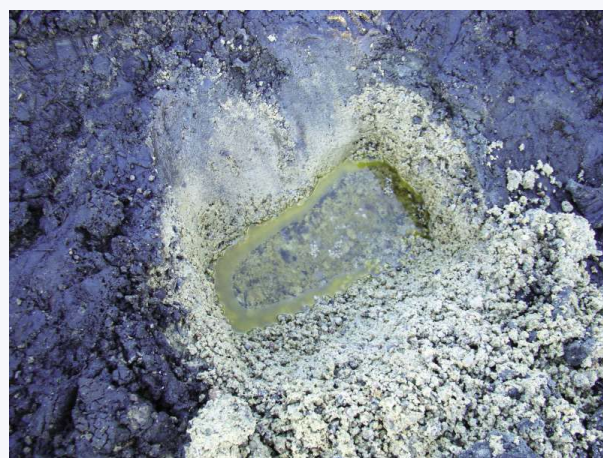
FOT. 3. Tor z płytą podtorza: odkrywka w środku toru między szynami; fot. : archiwa autorów

Głębokość uszkodzenia warstwy betonu dochodziła do 6 cm, widoczne były pręty zbrojenia konstrukcyjnego.