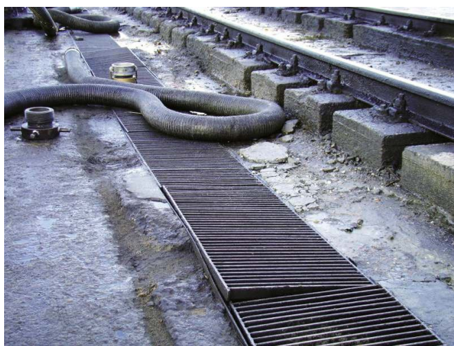
FOT. 4. Tor z płytą podtorza: uszkodzenia kanału odpływowego; fot. archiwum autorów.

Głębokość uszkodzenia warstwy betonu dochodziła do 6 cm, widoczne były pręty zbrojenia konstrukcyjnego.