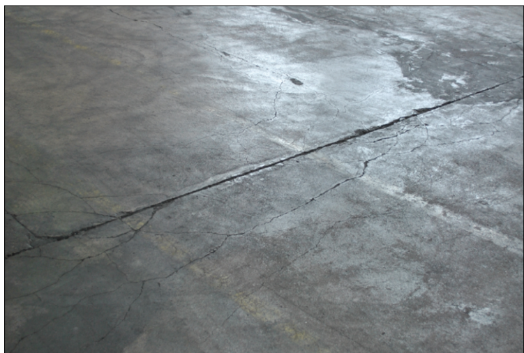
Fot. 4. Uszkodzona powierzchnia podłogi – nierówna i wytarta powierzchnia posadzki/zasyпки