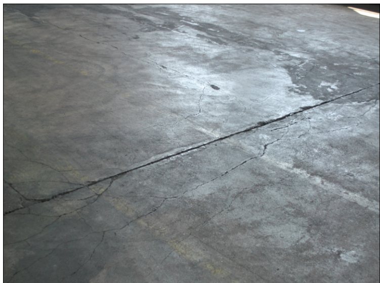
Fot. 2. Uszkodzona podłoga – przeciężona płyta podłogi