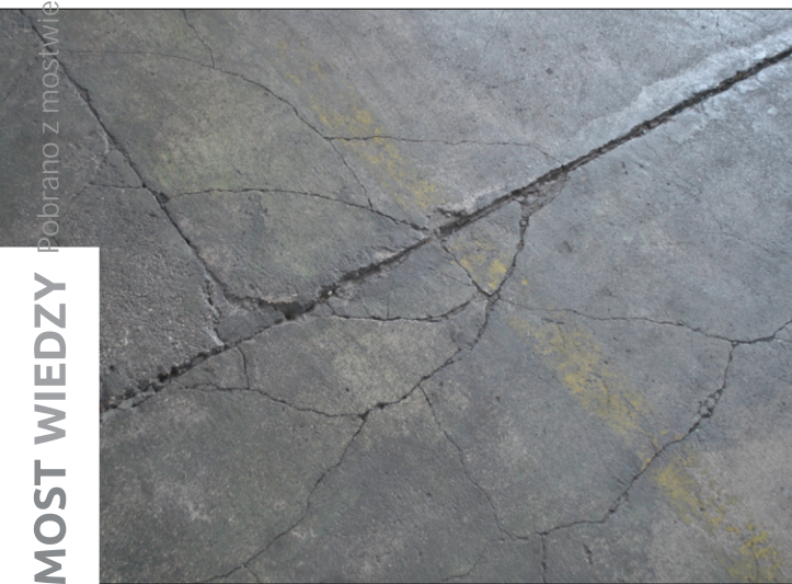
Fot. 3. Posadzka w narożnikach płyt – nieprawidłowa lokalizacja dylatacji