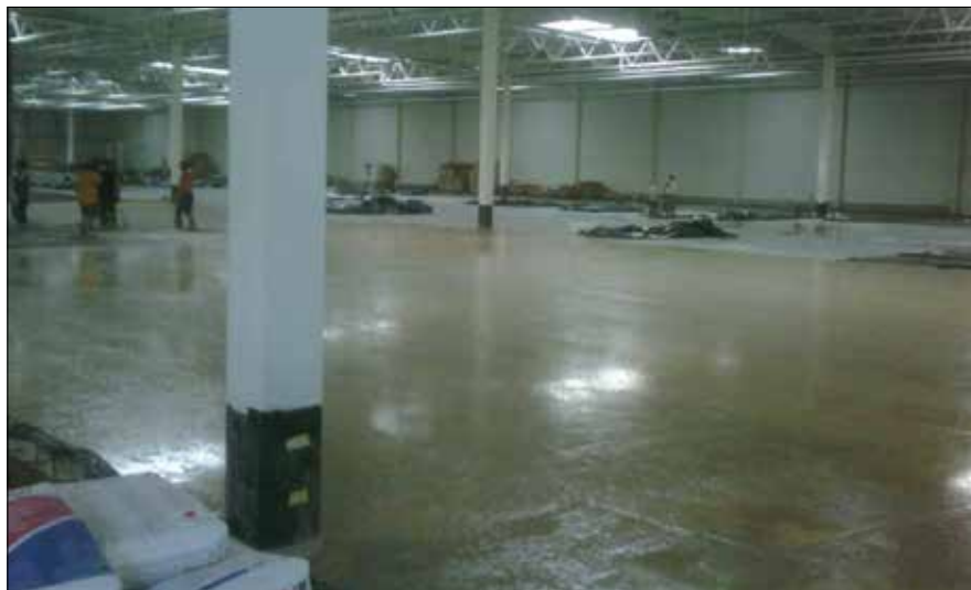
Fot. 1. Błyszcząca powierzchnia płyty podkładu w trakcie realizacji (w trakcie układania betonu, na powierzchni widoczne jest wytrącanie się zaczynu cementowego – bleeding)