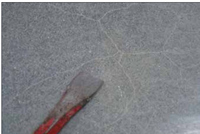
Fot. 2. Rysy na powierzchni posadzki wywołane skurczem