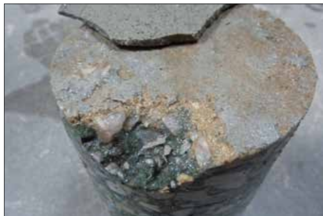
Fot. 3. Brak przyczepności warstwy utwardzonej do betonu podkładowego