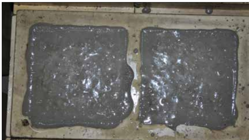
Fot. 7. Próbkę zarobów próbnych, na powierzchni próbek widoczny zaczyn cementowy (bleeding)