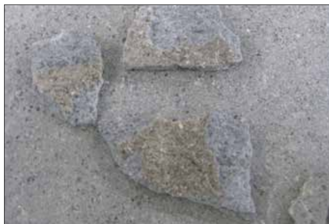
Fot. 5. Brunatne przebarwienia na dolnej powierzchni warstwy utwardzonej (posadzki)