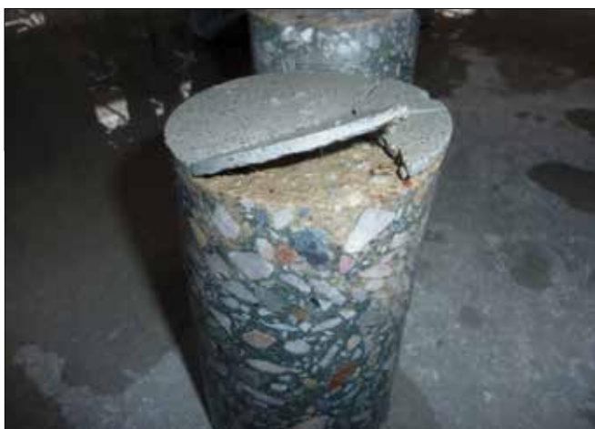
Fot. 4. Brak przyczepności warstwy utwardzonej do betonu podkładowego