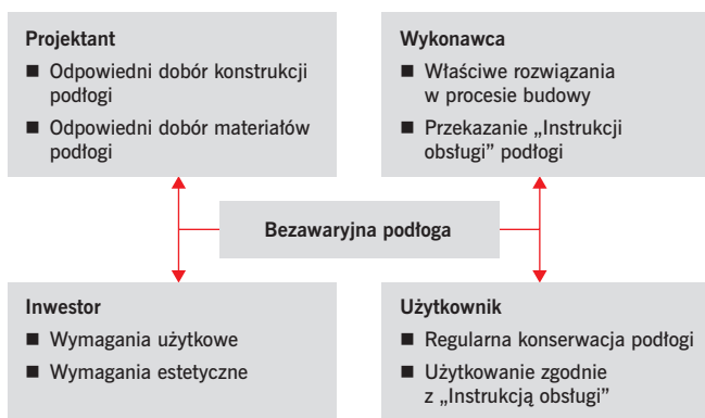
RYS. 1. Dobór rozwiązań bezawaryjnej podłogi przez uczestników procesu budowlanego; rys.: [5]

chłodniach itp., z reguły użytkowanych bez przerwy w tzw. systemie ciągłym. Usuwanie występujących usterek i uszkodzeń jest z reguły pracochłonne, bardzo kosztowne jak również często związane jest koniecznością czasowego wyłączenia pomieszczenia z użytkowania. Z tego względu już na początkowym etapie planowania inwestycji (w zakresie podłogi przemysłowej) zaleca określenie następujących kryteriów: