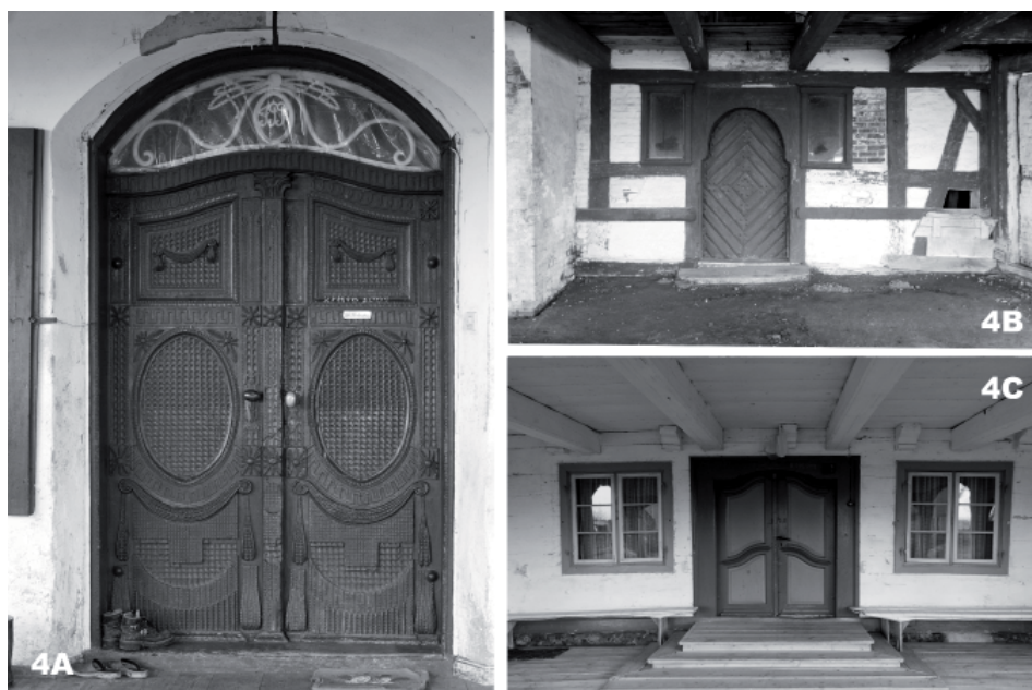
Fot. 4. Historyczne detale stolarki: 4A – empiorowe drzwi domu w Żłotowie (1790 r.), 4B – drzwi deskowo-klepkowe Nowa Kościelnica (1750 r.), 4C – barokowe drzwi w Rozgarcie (1749 r.).

Kształt domu ulegał przez cały czas ewolucji – od najstarszego, podłużnego typu z podcieniem w części szczytowej, prostopadłej do drogi, przez układ w kształcie litery „L” ze skrzydłem bocznym, aż do budynków umieszczanych kalenicą równoległą do ulicy, z wystawką ustawioną prostopadłe do głównej linii dachu (kształt litery „T”). Powodowane to było zmieniającym się prawodawstwem – należy pamiętać, że w 1772 r. Żuławy włączone zostały w wyniku I rozbioru do Prus i objęte tym samym Pruskim Prawem Krajowym, tzw. Landrecht [Krawczyk 1975], ale też obowiązującymi modami i stylami architektonicznymi. Na przykład wpływy barokowe widać wyraźnie w detalach drzwi domów w Żłotowie 2 (fot. 4A) czy Rozgarcie 3 (fot. 4C), gdzie barokowa kompozycja płycin niesie empiorowe elementy dekoracyjne, zapowiadające już klasycyzm, który w pełnej formie uwydatni się m.in. w projektach najbardziej znanego żuławskiego architekta – Petera Loewena 4 (fot. 2). Z kolei dziewiętnastowieczną fascynację modą na architekturę kuracyjną można odczytać w laubzegowych zakończeniach szczytów czy deskach osłaniających naroża budynków 5 . Ilustruje to nieustający dialog tradycji z obowiązującymi ówczesnie trendami.