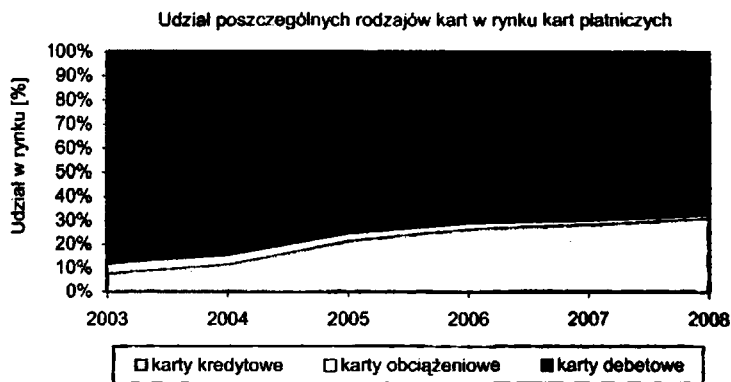
Rys. 3. Dynamika zmian rynku kart płatniczych w Polsce

Na rysunku 2 widać, że w Polsce dominujący udział na rynku kart płatniczych mają karty debetowe, których liczba na koniec 2008 roku sięgnęła blisko 20,5 miliona sztuk. Z roku na rok można zaobserwować także rosnącą liczbę kart kredytowych. Wzrost ten jest bardzo dynamiczny i od roku 2003 liczba kart kredytowych wzrosła z liczby 1,2 miliona sztuk do wolumenu prawie 9,5 miliona sztuk. Oznacza to wzrost blisko ośmiokrotny w porównaniu z początkiem analizy. Warto dodatkowo zaznaczyć, że całkowity udział kart kredytowych w liczbie wydanych kart ogółem jest na tyle dynamiczny, że nawet przy rosnącym rynku powoduje malejący udział kart debetowych w liczbie wydanych kart ogółem (rys. 3). Oznacza to, że dynamika kart kredytowych jest jeszcze większa niż dynamika całego rynku kart płatniczych. Mniejszym zainteresowaniem klientów cieszą się natomiast w ostatnich latach karty obciążeniowe. Liczba kart obciążeniowych od roku 2003 z 650 tysięcy sztuk spadła, aż o 35%, do poziomu 414 tysięcy. Malejący udział kart obciążeniowych, w rynku kart płatniczych ogółem, również można zaobserwować na rysunku 3.