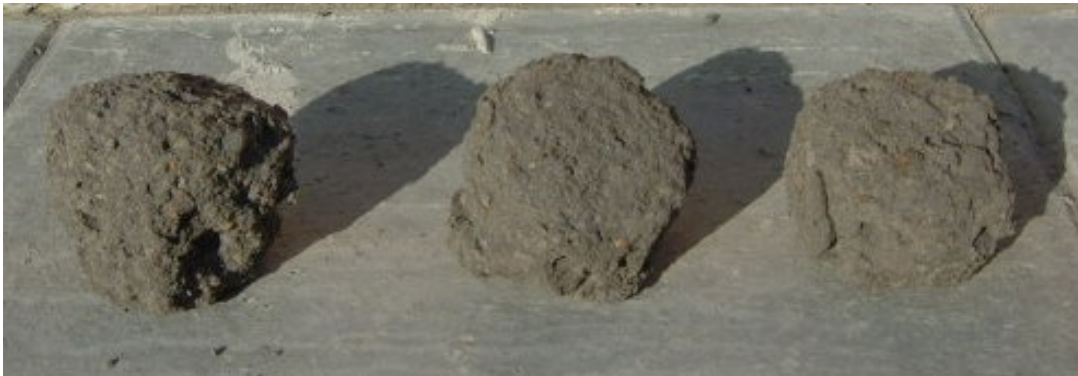
Zdjęcie 6. Próbkki mieszanki popiołowo-piaskowej stabilizowanej cementem po badaniu mrozoodporności

Patrząc na powyższe zdjęcia i wymagania zawarte w tablicy 5 można stwierdzić, że dla wielu materiałów spoistych uzyskanie wymaganego wskaźnika mrozoodporności będzie możliwe tylko przy zastosowaniu większej ilości spoiwa a więc i uzyskując jednocześnie dużo większe wytrzymałości. Ponieważ górne dopuszczalne wytrzymałości zostały zdefiniowane zupełnie inaczej jest to możliwe, ale zapewnienie tych parametrów musi odbyć się kosztem zwiększonej ilości spoiwa a więc i większych nakładów finansowych.