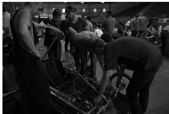
Rys. 3. Pojazd P16 podczas testu instalacji pneumatycznej w trakcie zawodów Aventics Pneumobile 2016 [1]