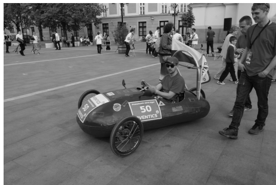
Rys. 4. Pojazd P16 podczas parady pojazdów w trakcie zawodów Aventics Pneumobile 2016 [1]