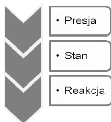
Rys. 3. Model procesów miasta wykorzystywany do weryfikacji WPMPW

nizację Narodów Zjednoczonych (ONZ) dotyczącym zrównoważonego rozwoju. W wydanej Agendzie 21 (United Nations Conference on Environment & Development, 2015) istotność informacji w procesie podejmowania decyzji (na szczeblu krajowym) była szeroko dyskutowana. Stwierdzono, że istnieje brak zdolności do zbierania i przypisywania danych, ale przede wszystkim ich przekształcania w potrzebne informacje oraz ich dalsze rozpowszechnianie. (United Nations Conference on Environment & Development, 2015). Następnie bazując na wieloletnich badaniach zaproponowano model dedykowany zrównoważonemu rozwojowi miasta, który składa się ze 130 wskaźników podzielonych na trzy obszary: presja otoczenia, stan obecny, reakcja. Bazując na przedstawionym rozwiązaniu sugerujemy zastosowanie przedstawionego podziału do zorganizowania KPI stosowanych w zarządzaniu miastem (rys. 3).