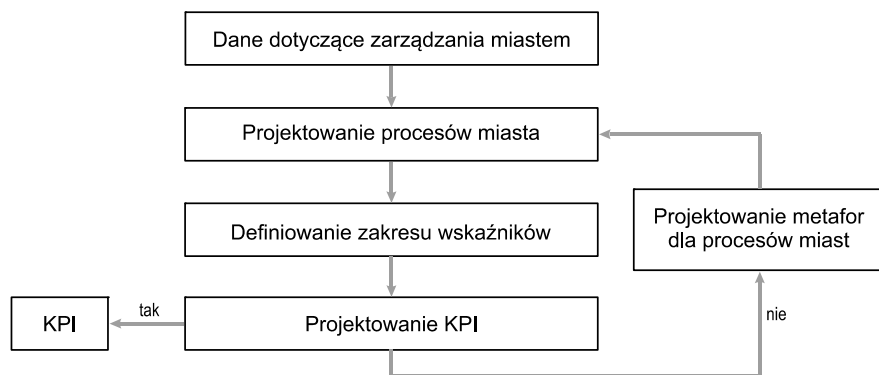
Rys. 1. Wysokopoziomowy model projektowania wskaźników KPI

Na rysunku 1 przedstawiono WPMPW na którym widoczne są trzy warstwy (modele miasta, wskaźników zagregowanych oraz wskaźników KPI, które stanowią podstawę do pomiaru tych procesów miasta, istotnych z punktu widzenia modeli miasta). Wektor sprzężenia zwrotnego widoczny na tym rysunku oraz regulator znajdujący się po prawej stronie wskazuje kierunek i obszar procesów projektowania. To model miasta stanowi swoistego rodzaju dane niezbędne dla projektowania wskaźników. Na podstawie modelu miasta wybiera się procesy i przyporządkowuje tym procesom miary. Wówczas agregowanie wskaźników odbywa się w oparciu o procesy wyodrębnione w ramach modeli i przyporządkowuje się im odpowiednie miary.