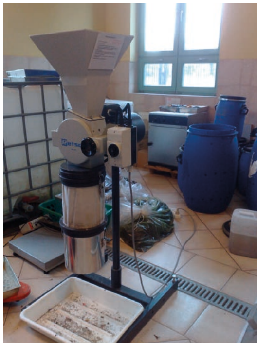
Rys. 1. Młynek tnący (Retsch SM100, Niemcy)

Przed użyciem do badań kisonkę rozdrabniano w młynku tnącym (Retsch SM100, Niemcy) (rys. 1), a następnie 2-krotnie przesiewano przez dwa sита o różnej średnicy oczek. Pierwsze przesiewania prowadzono na sitach o średnicy oczek równej 1,5 mesh, natomiast drugie – na sitach o średnicy oczek 0,5 mesh. Stężenie suchej pozostałości ogólnej wynosiło 0,1412 g s.m./g, w tym stężenie suchej pozostałości organicznej – 0,1373 g s.m./g. Kisonka sorgo cukrowego charakteryzowała się wysoką zawartością cukrów rozpuszczalnych, kształtującą się na poziomie 17,5% s.m. Stężenie lignin, celuloz oraz hemi-