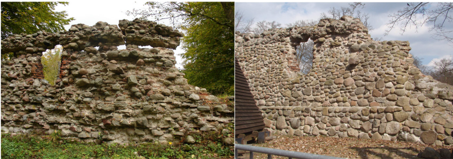
Ryc. 4 Fragment muru „Kujaw”: utrata „dramatyzmu” ceną za zachowanie zabytku... (2007, 2014)