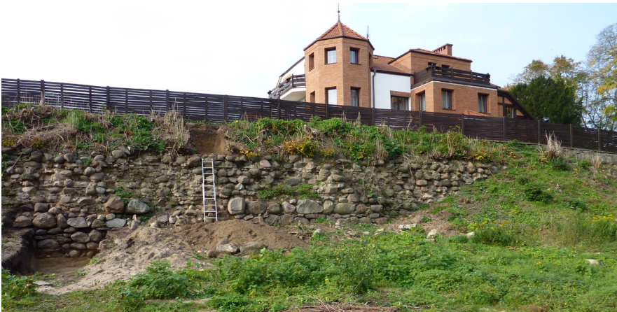
Ryc. 5 Mur skarpy przedzamcza zachodniego. Odkrywka archeologiczna po lewej stronie ukazuje głębokość posadowienia; widoczny budynek – prawdopodobna przyczyna zawalenia długiej partii muru (2017)