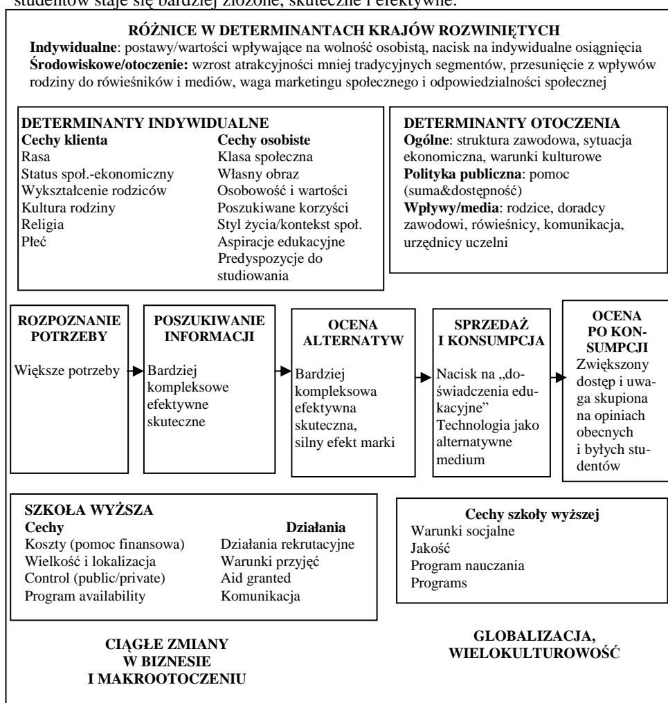
Rys. 2. Współczesny model wyboru studentów dla krajów rozwiniętych ( higher education student-choice model for developed countries )

potrzeby niż ci z krajów mniej rozwiniętych. Na zdefiniowanie potrzeb klientów w tych krajach większy wpływ ma komunikacja marketingowa, która adekwatnie do rosnących potrzeb również się zmienia. Innym założeniem do niniejszego modelu jest fakt, że zachowanie klientów w krajach rozwiniętych zmienia się szybciej ze względu na szersze otoczenie marketingowe. Zmieniają się segmenty i ich cechy (np. zyskowność). Ze względu na dostępność technologii (np. Internet), intensywność komunikacji marketingowej i wzrost liczby dostępnych możliwości poszukiwanie informacji przez studentów staje się bardziej złożone, skuteczne i efektywne.