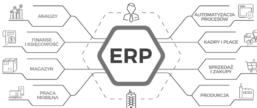
Rys. 1. Schemat i moduły systemu ERP

Utrzymanie ruchu urządzeń to przede wszystkim [2]: - zapewnienie wysokiej jakości wyrobów, - maksymalizacja ekonomicznego okresu użytkowania parku maszynowego, - maksymalizacja zdolności produkcyjnych, - minimalizacja kosztów utrzymania urządzeń w sprawności eksploatacyjnej, - zapewnienie bezpiecznych warunków eksploatacji parku maszynowego.