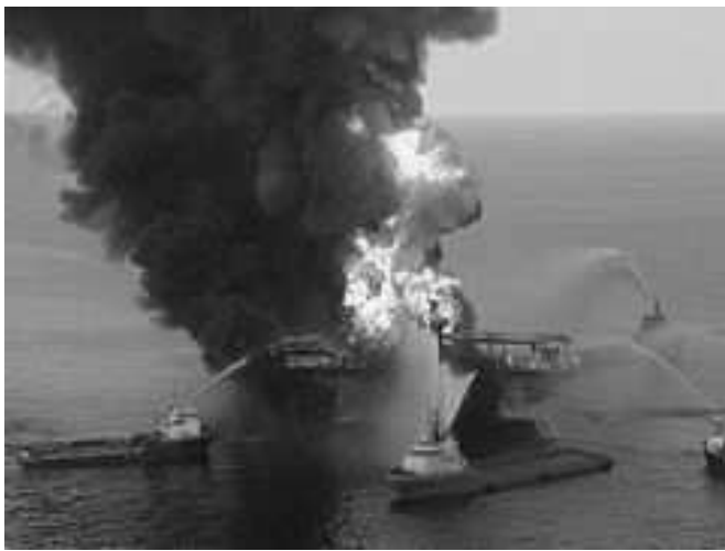
Rys. 2. Eksplozja platformy wiertniczej Deepwater Horizon [5]

Historia pokazała na przykładzie katastrofy w 2010 roku jak wielkie znaczenie ma utrzymywanie krytycznych urządzeń na obiekcie offshore (ang. na morzu) we właściwym stanie technicznym. Na rysunku 2 eksplozja platformy wiertniczej Deepwater Horizon, która miała miejsce 20 kwietnia 2010.