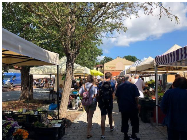
Fot 1 (wejście z widokiem na główną alejkę)