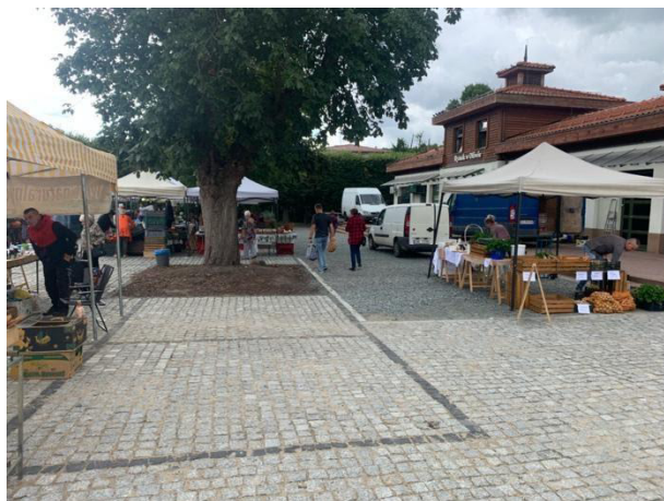
Fot 3 ( od strony przejazdu przy latarni pomiędzy budynkiem i drzewami widok w stronę ul. Obrótców Westerplatte)