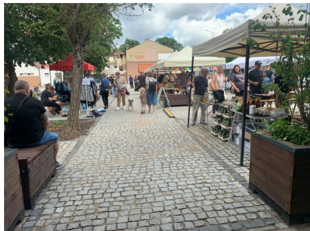
Fot 1 (wejście z widokiem na główną alejkę)