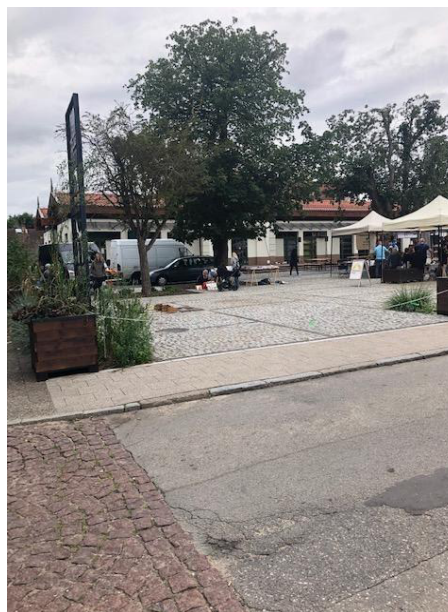
Fot 4 (z narożnika ul Schopenhauera + ob. Westerplatte, jak wizualizacja)