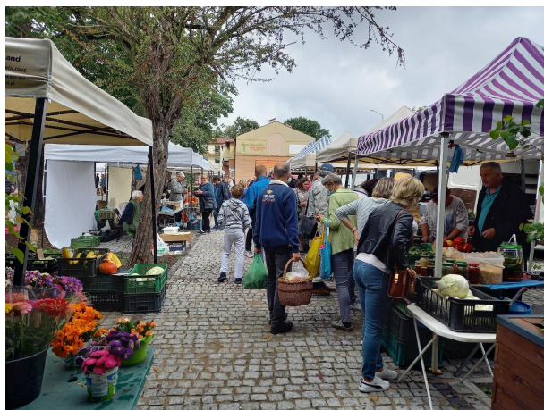
Fot 1 (wejście z widokiem na główną alejkę)