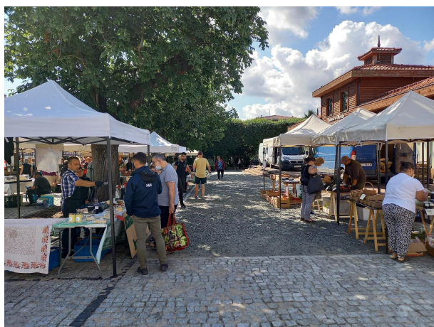
Fot 3 ( od strony przejazdu przy latarni pomiędzy budynkiem i drzewami widok w stronę ul. Obrońców Westerplatte)