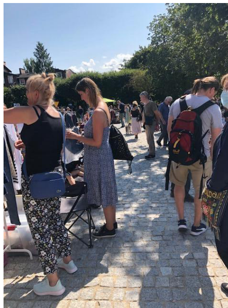
Fot 2 (na końcu alejki z widokiem na wejście)