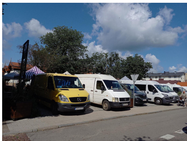
Fot 4 (z narożnika ul Schopenhauera + ob. Westerplatte, jak wizualizacja)