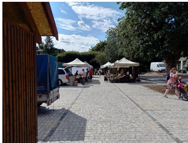
Fot 2 (na końcu alejki z widokiem na wejście)