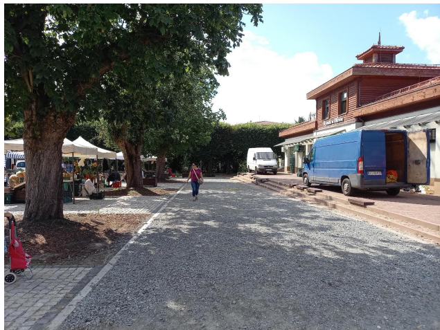
Fot 3 ( od strony przejazdu przy latarni pomiędzy budynkiem i drzewami widok w stronę ul. Obrońców Westerplatte)