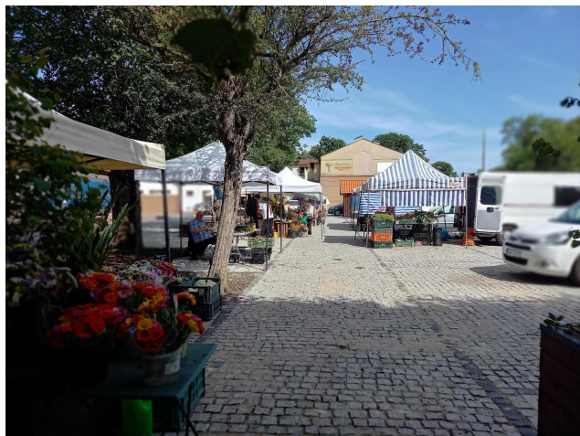
Fot 1 (wejście z widokiem na główną alejkę)