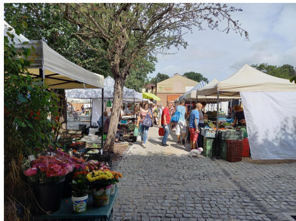
Fot 1 (wejście z widokiem na główną alejkę)