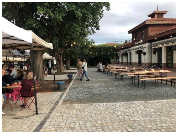
Fot 3 ( od strony przejazdu przy latarni pomiędzy budynkiem i drzewami widok w stronę ul. Obrońców Westerplatte)