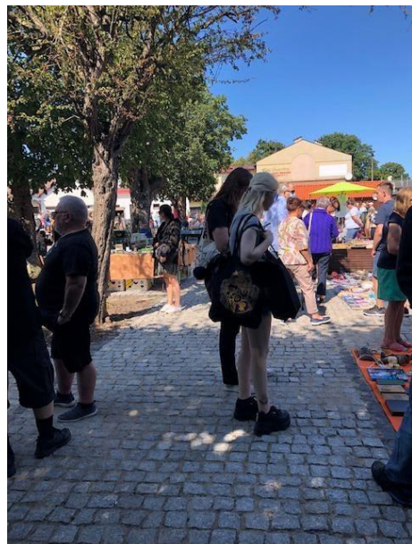
Fot 1 (wejście z widokiem na główną alejkę)