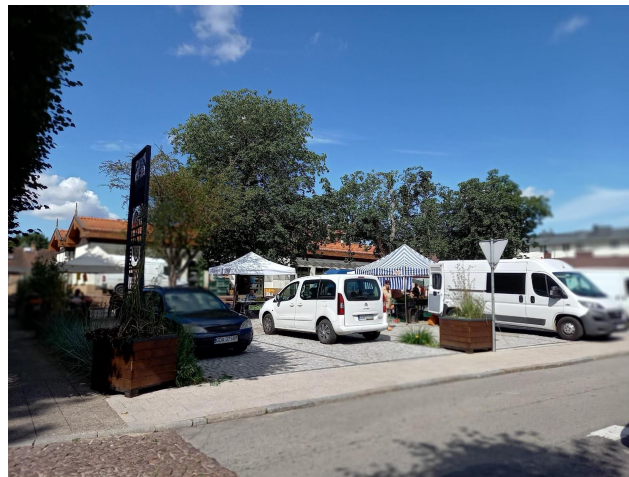
Fot 4 (z narożnika ul Schopenhauera + ob. Westerplatte, jak wizualizacja)