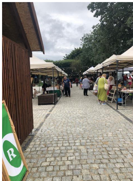
Fot 2 (na końcu alejki z widokiem na wejście)