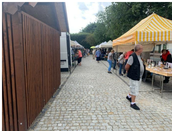
Fot 2 (na końcu alejki z widokiem na wejście)