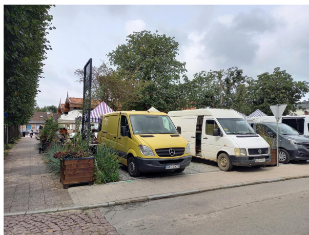
Fot 4 (z narożnika ul Schopenhauera + ob. Westerplatte, jak wizualizacja)