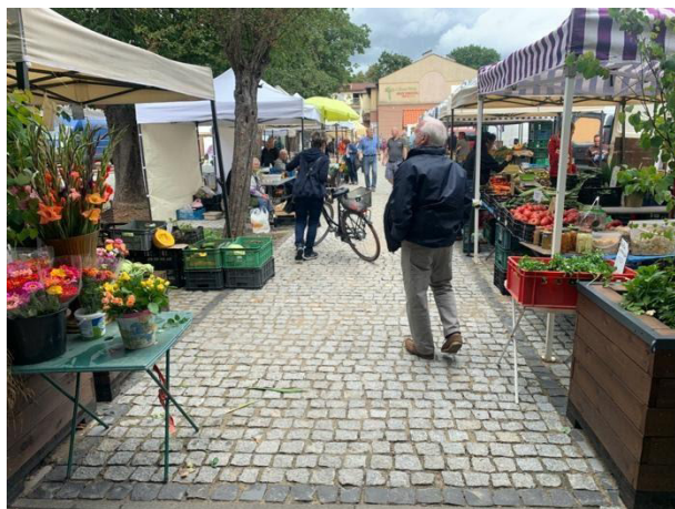
Fot 1 (wejście z widokiem na główną alejkę)