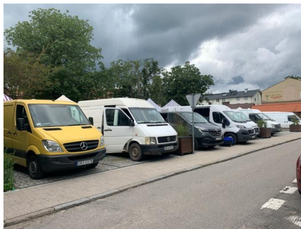
Fot 4 (z narożnika ul Schopenhauera + ob. Westerplatte, jak wizualizacja)