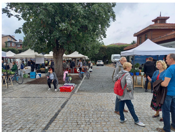
Fot 3 ( od strony przejazdu przy latarni pomiędzy budynkiem i drzewami widok w stronę ul. Obrońców Westerplatte)