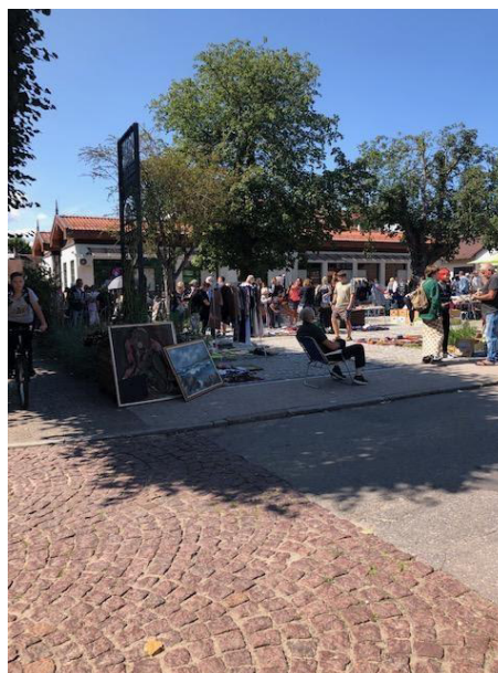
Fot 4 (z narożnika ul Schopenhauera + ob. Westerplatte, jak wizualizacja)