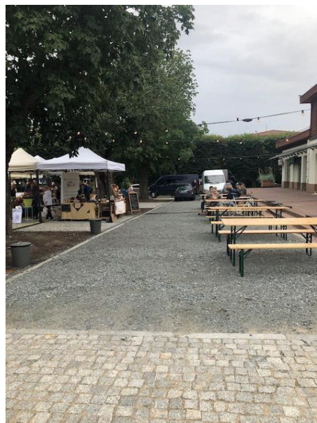
Fot 3 ( od strony przejazdu przy latarni pomiędzy budynkiem i drzewami widok w stronę ul. Obrońców Westerplatte)