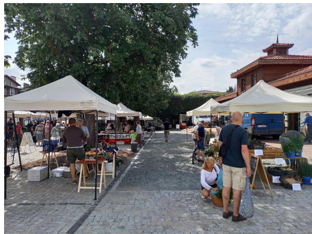
Fot 3 ( od strony przejazdu przy latarni pomiędzy budynkiem i drzewami widok w stronę ul. Obrońców Westerplatte)