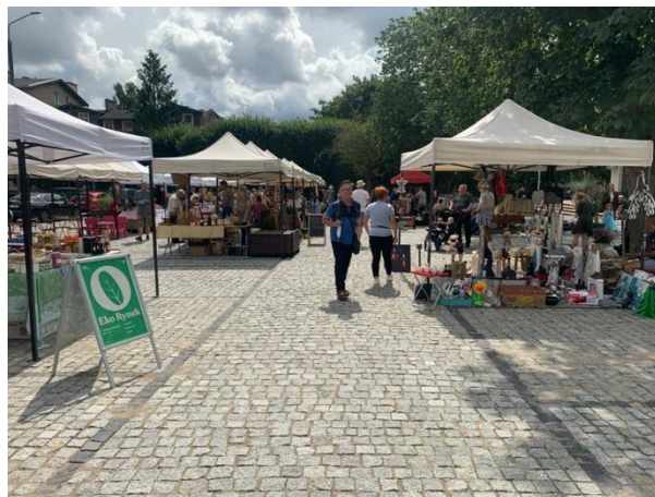
Fot 2 (na końcu alejki z widokiem na wejście)