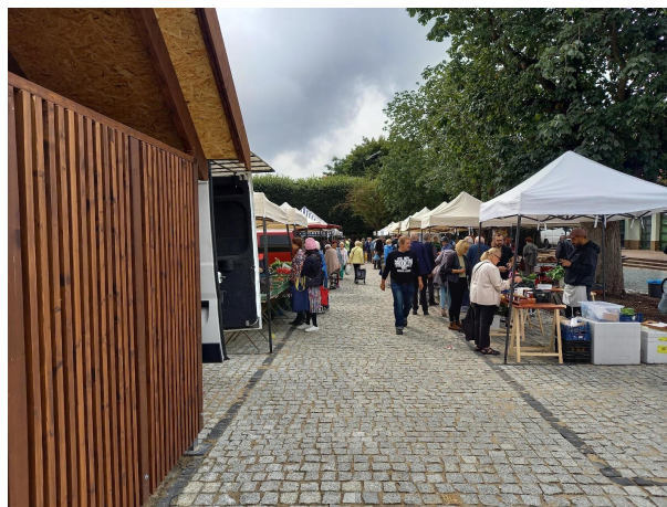
Fot 2 (na końcu alejki z widokiem na wejście)