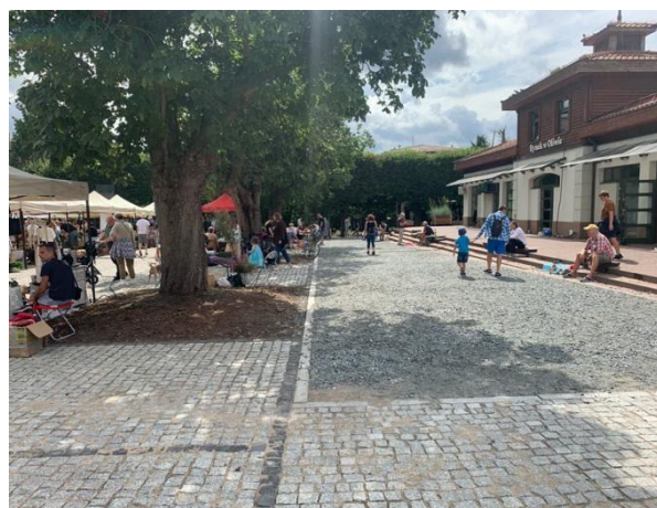
Fot 3 ( od strony przejazdu przy latarni pomiędzy budynkiem i drzewami widok w stronę ul. Obróćców Westerplatte)