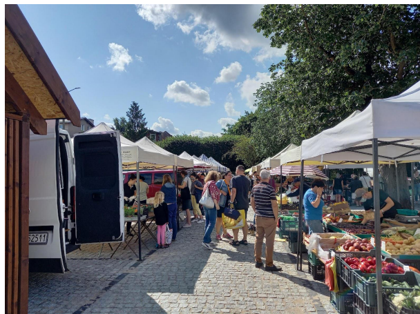
Fot 2 (na końcu alejki z widokiem na wejście)