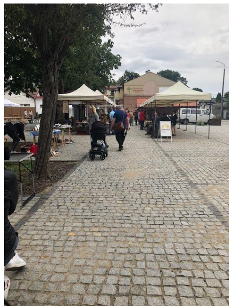
Fot 1 (wejście z widokiem na główną alejkę)