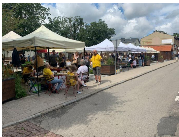
Fot 4 (z narożnika ul Schopenhauera + ob. Westerplatte, jak wizualizacja)