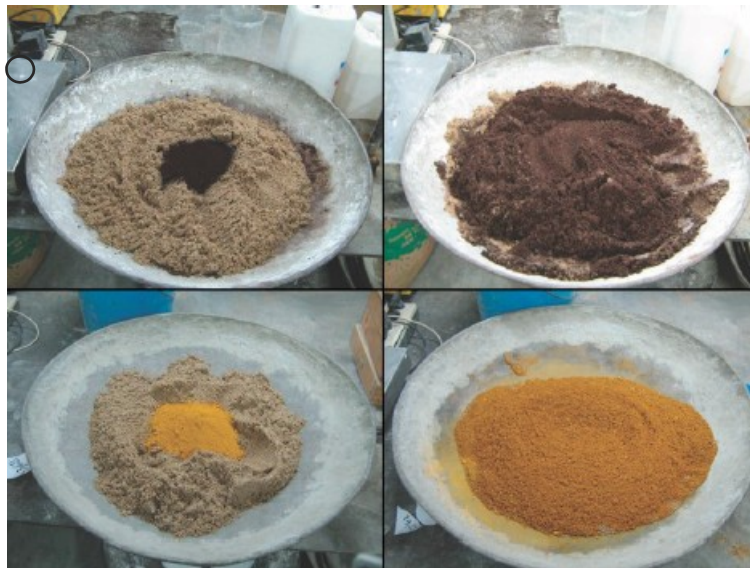
Fot. 1 Zaroby próbne – mieszanka betonowa z barwnikiem

Podstawą do badań pigmentów jest norma PN-EN 12 878. W normie tej zdefiniowane są wymagania dla pigmentów do barwienia materiałów budowlanych na bazie cementu i wapna. Określa ona graniczne wielkości wpływu pigmentu na wytrzymałość betonu oraz na przebieg wiązania cementu. Norma ta pozwala również określić siłę koloru – jego nasycenie. Zdolnością barwiącą pigmentu określa się możliwość przenoszenia barwy własnej pigmentu na barwione medium. W celu określenia siły koloru pigmentu porównuje się go z pigmentem wzorcowym. Siła barwiąca jest ważną cechą pigmentu. Przekłada się ona bezpośrednio na rachunek ekonomiczny. W celu określenia optymalnej ilości pigmentu w mieszance betonowej zaleca się sporządzenie prób przed wykonaniem elementów betonowych.