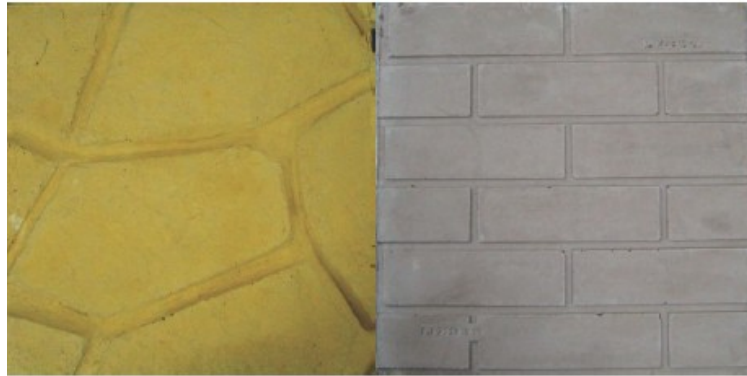
Fot. 2 Próbki z betonu barwionego