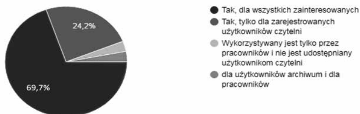
Rysunek 1. Udostępnianie księgozbiorów bibliotek archiwalnych – stan na 2017 r.