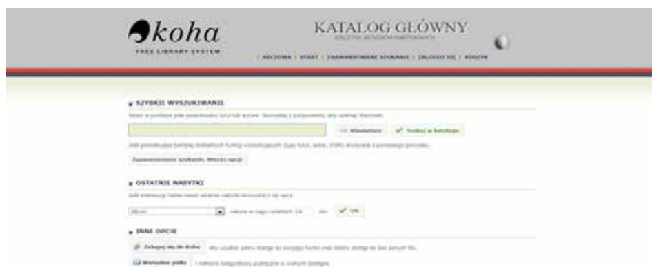
Rysunek 3. Strona główna katalogu bibliotek archiwalnych (system Koha)

Retrokonwersja katalogów bibliotecznych, dzięki wdrożeniu systemu KOHA (Rys. 3), obejmie i ujednoczi w zasadzie wszystkie czynności – gromadzenie księgozbioru, katalogowanie, opracowanie oraz udostępnianie i z pewnością zapobiegnie wykluczeniu bibliotek archiwalnych z grona instytucji stanowiących repozytoria wiedzy. Dla bibliotek, w których funkcjonowały dotąd programy biblioteczne, jak np. MAK, czy LIBRA 2000, przejście do systemu KOHA nie będzie zbyt dużą zmianą. Trudniej będzie nadrobić zaległości z powodu nawarstwiających się przez dekady nieprawidłowości w katalogowaniu księgozbioru w pozostałych bibliotekach, w których funkcjonowały do tej pory katalogi kartkowe lub wykazy tytułów (w postaci plików Word, Excel, baz danych Access), wspólne księgi inwentarzowe dla książek i czasopism, itd. Pocięszający jest jednak fakt, że migracja danych ze stosowanych do tej pory programów (m.in. w bibliotece AP Lublin, AP Katowice, AP Przemyśl) przeszła pomyślnie i powstał katalog wzorcowy, z którego mogą kopiować opisy i dodawać lokalnie swoje egzemplarze inne biblioteki archiwalne. Opisy mogą być także kopiowane poprzez protokół Z39.50 z centralnego katalogu zbiorów polskich bibliotek naukowych – NUKAT.