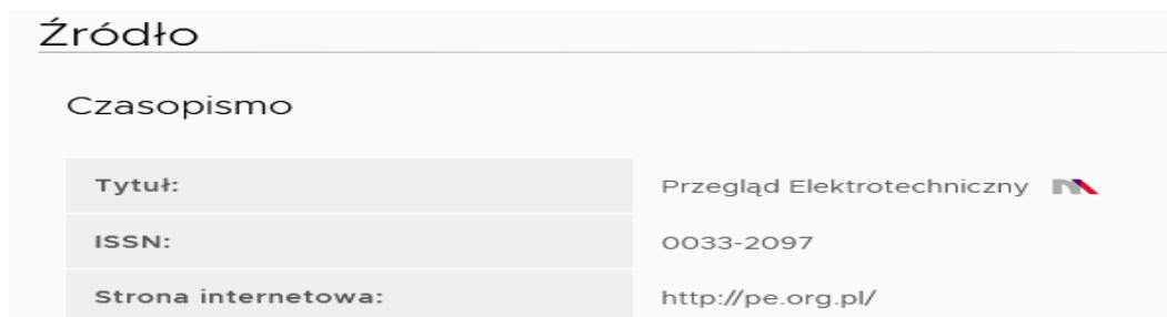
Rys.. 5. Widok fragment rekordu publikacyjnego w bazie PBN (system POL-on) z ikonką MNiSW/MEiN (dostęp www: 2.10.2022.)