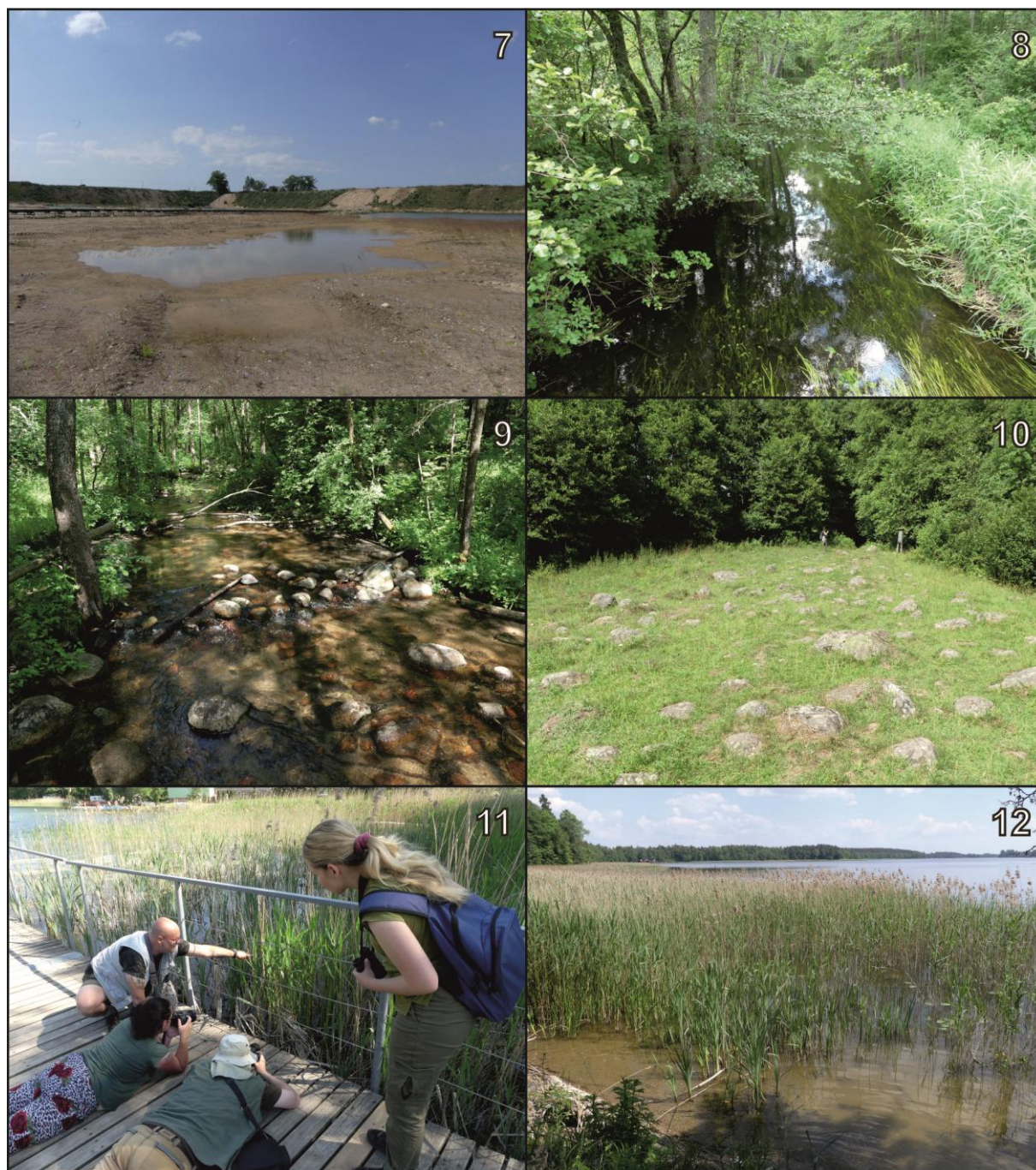
Ryc. 3. Stanowiska nr 7-12 (numeracja jak w tekście i na Ryc. 1).

Fig. 3. Study sites 7-12 (numbering as in the text and in Fig. 1).