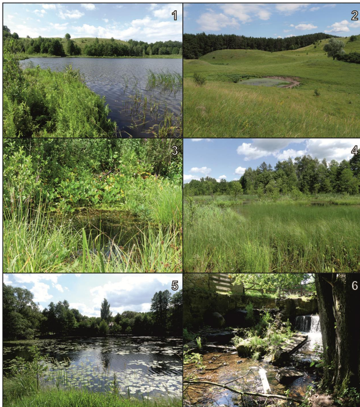
Ryc. 2. Stanowiska nr 1-6 (numeracja jak w tekście i na Ryc. 1).

Odcinek płynący przez las łęgowy, przeważnie ocieniony, z przenikającym do dna lasu światłem słonecznym tworzącym plamy słońca. Szerokość koryta 4-5 m, głębokość do 30 cm, dno piaszczysto-żwirowe z większymi kamieniami i dużą ilością martwego drewna, woda żółtawa, przejrzysta, nurt średnio szybki. Brak roślin w wodzie, brzeg z drzewami i płacami wysokich, kępiastych turzyc.