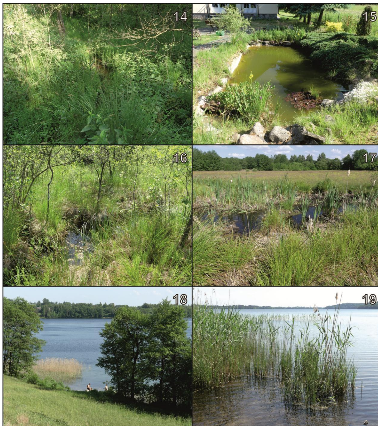
Ryc. 4. Stanowiska nr 14-19 (numeracja jak w tekście i na Ryc. 1).

Fig. 4. Study sites 14-19 (numbering as in the text and in Fig. 1).