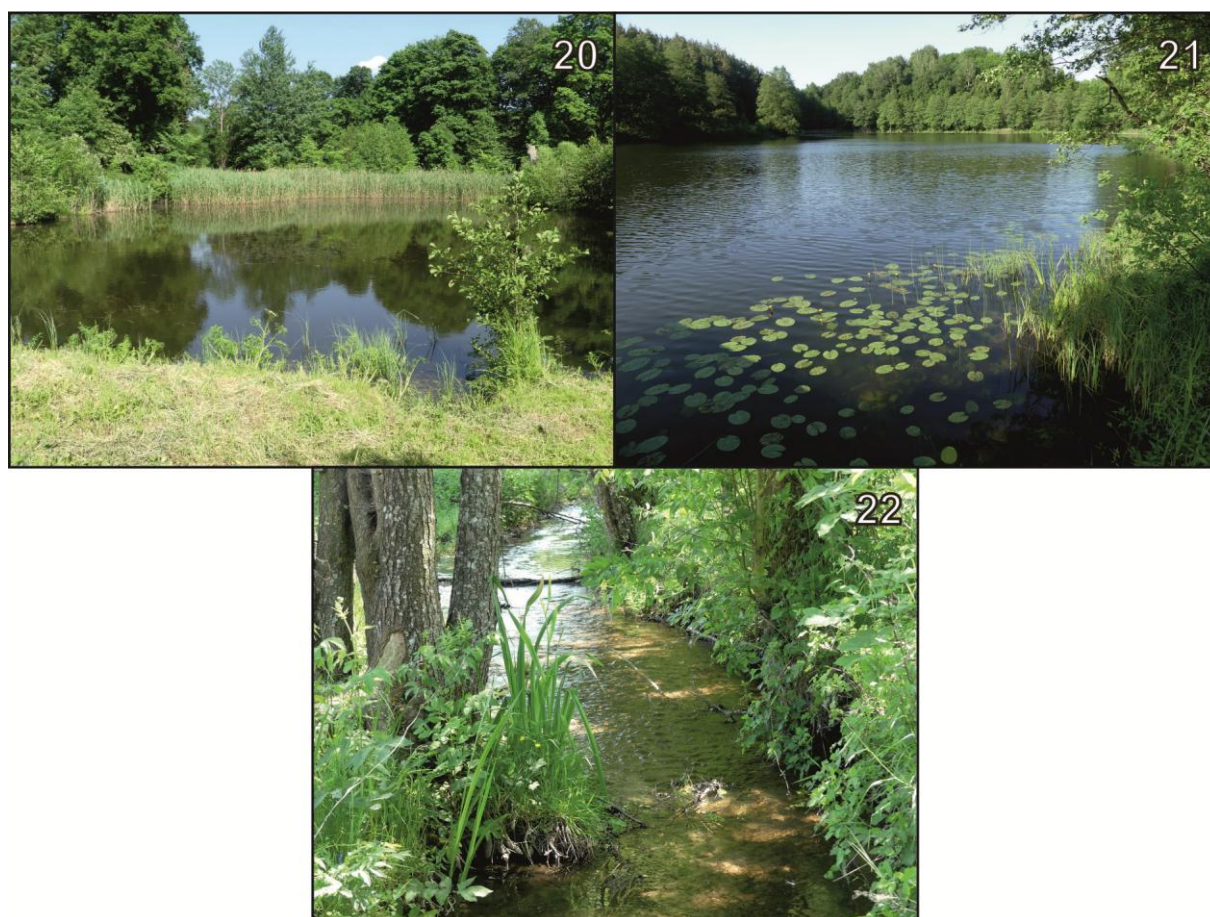
Ryc. 5. Stanowiska nr 20-22 (numeracja jak w tekście i na Ryc. 1).

Krótki strumień łączący umiarkowanie eutroficzne Jezioro Udziejek (cf. GÓRNIK i in. 2017) z rzeką Szeszupą, płynący wśród łąk i ugorów, obrzeżony pasem dużych drzew olchy czarnej. Woda przejrzysta, bezbarwna, nurt umiarkowanie szybki. Szerokość ok. 3-5 m, głębokość do 20 cm, dno piaszczysto-żwirowe. Brak roślin w wodzie.