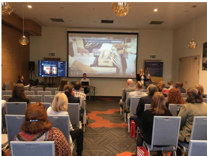
Fot. 3. IATUL Seminar 2019