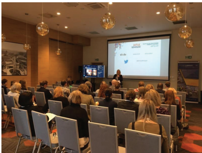
Fot. 2. IATUL Seminar 2019

Aspects (program wydarzenia: https://pg.edu.pl/biblioteka-pg/programme ). IATUL Seminar odbywa się co roku w innym kraju członkowskim, co nadaje wydarzeniu cykliczny charakter. Przedstawiciele bibliotek akademickich zrzeszonych w IATUL spotykają się w celu wymiany swoich doświadczeń, podsumowania dotychczasowych osiągnięć oraz określenia przyszłych wyzwań. Tegoroczna konferencja zgromadziła ok. 60 osób, reprezentujących ośrodki akademickie z różnych zakątków świata (zob. fot. 2). Wśród uczestników byli nie tylko bibliotekarze i naukowcy, ale także inne osoby zaangażowane w rozwój nauki. IATUL Seminar 2019 było na bieżąco relacjonowane i promowane w mediach społecznościowych BPG na Twitterze i Facebooku (#IATUL19Poland).