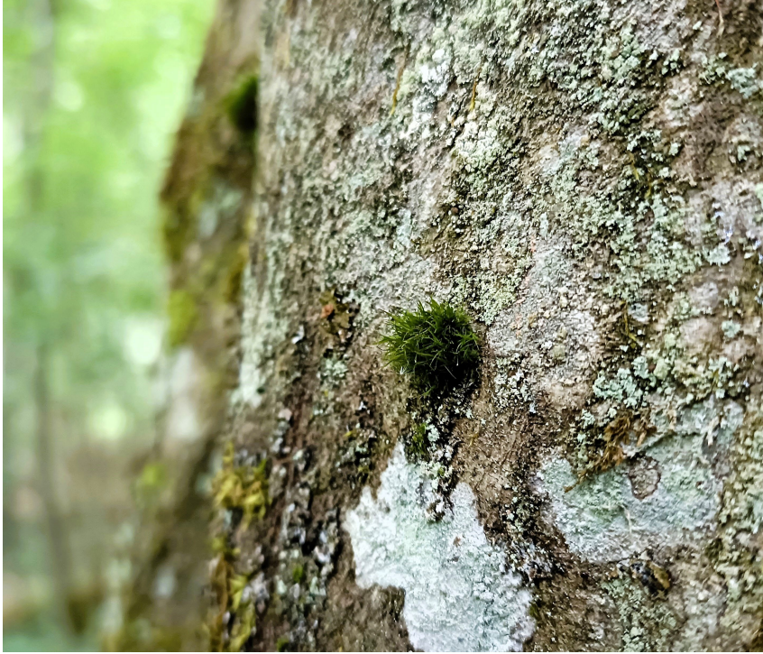
Ryc. 2. Fragment darni Dicranum viride w Wigierskim Parku Narodowym