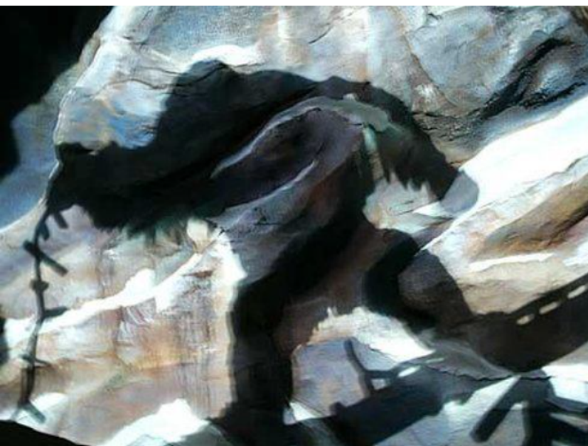
Ryc.3. Mityczny gołub-jawana jest niedźwiedziem.