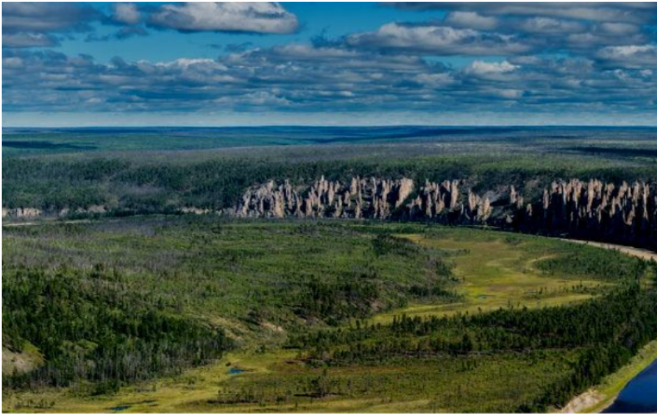
Ryc.6. Skamieniały las Jakucji.

spodziewajmy się nawrotu pradawnych gatunków megafauny. Ważne jest, aby pamiętać, iż wielka Jakucja skrywa do dzisiaj także być może pewne zwierzęce formy, ukryte jeszcze w odległym interiorze, w tym terra incognita północnej Euroazji.