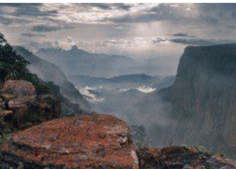
Ryc.2. Bié Plateau.