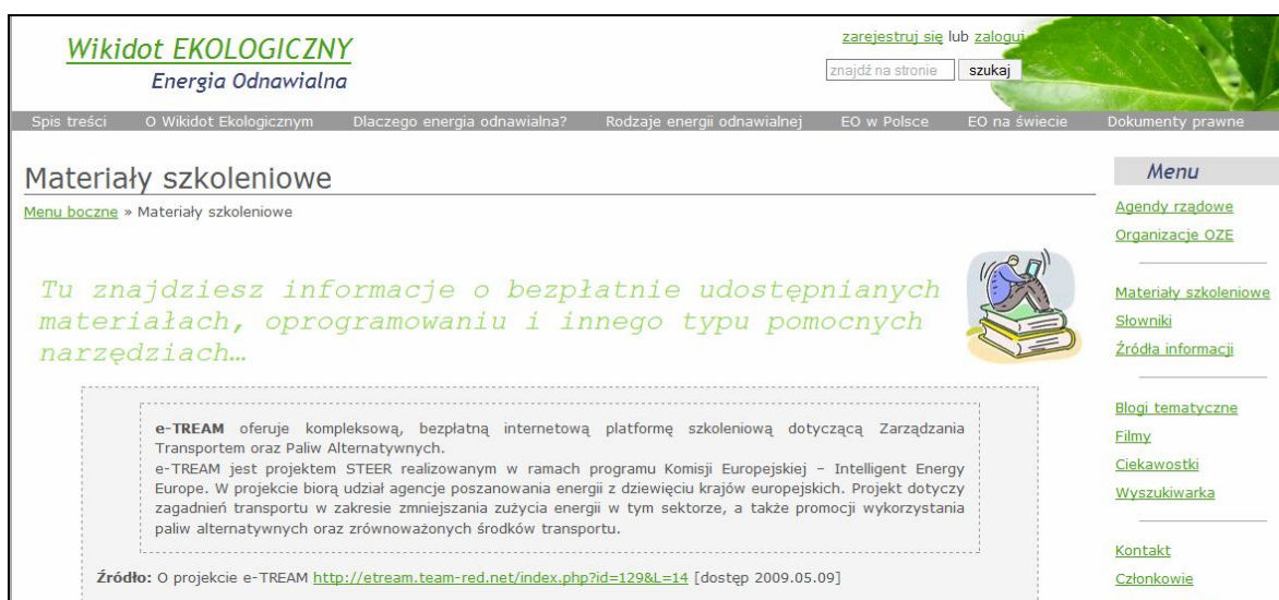
Rys. 4. Dział „Materiały szkoleniowe” w serwisie Wikidot EKOLOGICZNY .

Dział „Materiały szkoleniowe” (rysunek 4) zawiera przykłady bezpłatnych platform szkoleniowych w dostępie online, przygotowywanych przez organizacje branżowe i instytucje edukacyjne. Zamieszczenie tego typu informacji jest ważnym uzupełnieniem zasobów zawartych w serwisie, umożliwiającym spojrzenie na dany problem od strony praktyczno-technicznej, a nie jedynie teoretycznej. Większość użytkowników Internetu wykorzystująca podstawowe funkcje popularnych wyszukiwarek, w zasadzie nie ma szans na dotarcie do tego typu materiałów. Z tego też względu umiejętności infobrokerskie dają perspektywę kreowania nowych zasad tworzenia serwisów, polegających na pełnym ujęciu problemu - wiedza teoretyczna oraz jej praktyczne wykorzystanie.