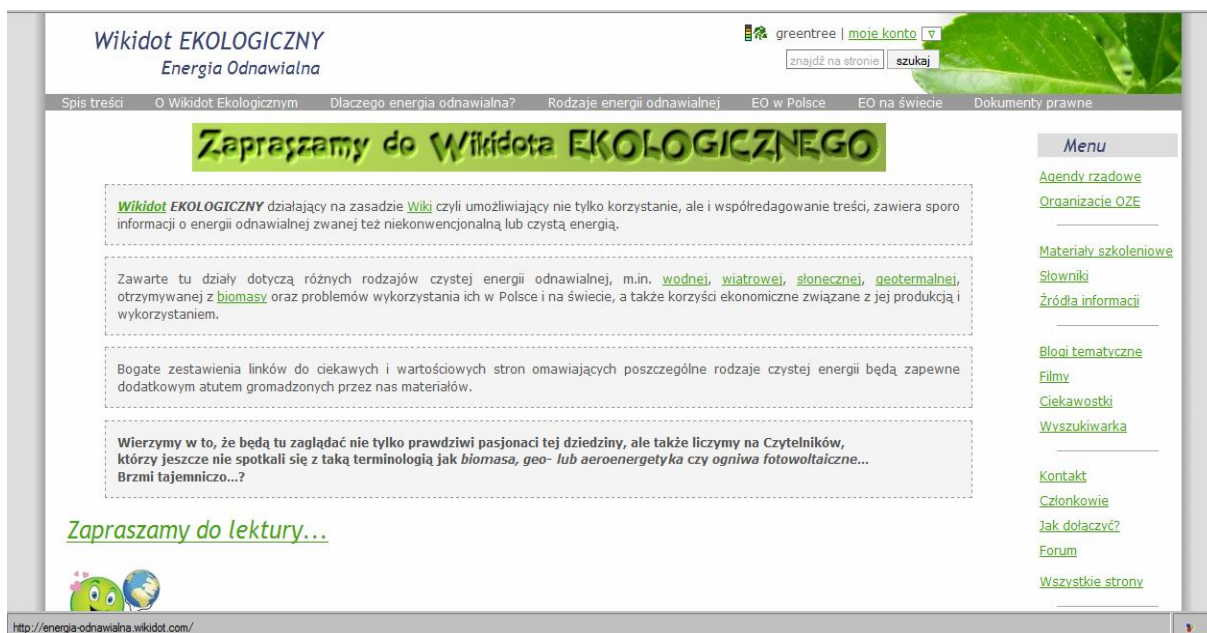
Rys. 2. Strona startowa Wikidota EKOLOGICZNEGO .

Ponieważ serwis ma być skierowany do użytkownika mającego przynajmniej podstawową wiedzę teoretyczną i techniczną na ten temat, wyszukane publikacje, prezentacje czy filmy instruktażowe powinny pogłębiać i rozwijać tę wiedzę. Nie oznacza to jednak, że przypadkowo zaglądnący na stronę internauta, który nie zetknął się dotychczas tą tematyką nie będzie w stanie zrozumieć, na czym polega wykorzystywanie wody, wiatru czy promieni słonecznych do produkcji energii elektrycznej. Wikidot EKOLOGICZNY w swym założeniu nie jest serwisem naukowym w dosłownym słowa tego znaczeniu, aczkolwiek wśród zgromadzonych materiałów źródłowych są artykuły pochodzące z czasopism naukowych czy portali internetowych uznawanych powszechnie za wiarygodne źródła informacji (strony stowarzyszeń, agend rządowych, urzędów statystycznych, itp.).