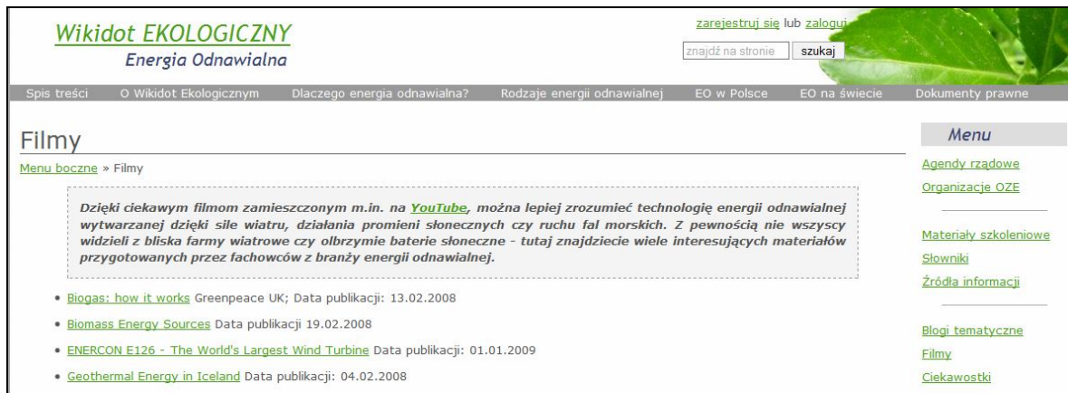
Rys. 6. Dział „Filmy” w serwisie Wikidot EKOLOGICZNY.

Dokonując wyboru filmów dodatkowo autorka przeprowadziła szczegółową ocenę jakościową, stosując kryteria selektywne i wartościujące opracowane zgodnie z wymogami klienta (rysunek 7). Kryteria selektywne musiały być bezwzględnie spełnione.