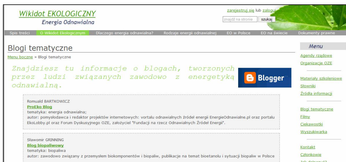
Rys. 5. „Blogi tematyczne” w serwisie Wikidot EKOLOGICZNY.

Rysunki 5 i 6 prezentują kolejno dział „Blogi”, w którym umieszczono krótkie charakterystyki blogów prowadzonych przez fachowców z branży energetyki odnawialnej wraz z odnośnikami oraz dział „Filmy”, z linkami do wartościowych filmów dostępnych na YouTube oraz na stronach Komisji Europejskiej. Zasoby multimedialne pozwalają lepiej zrozumieć zasady działania np. elektrowni wiatrowych, ogniw fotowoltaicznych lub wykorzystujących ruch fal morskich.