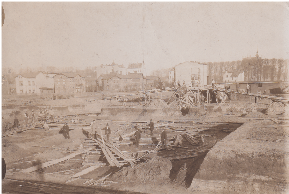
2. Plac budowy gdańskiej uczelni technicznej, wykopy pod fundamenty, widok od strony południowo-wschodniej; w lewym dolnym rogu widoczny cień fotografa, lato 1901 roku