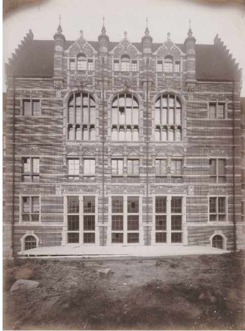
5. Gmach Główny, część centralna elewacji południowej, wiosna 1904 roku