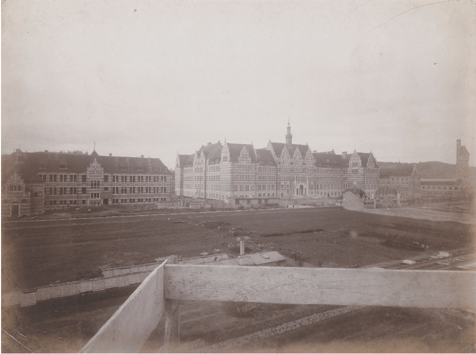
1. Politechnika Gdańska (Technische Hochschule Danzig), widok od strony północno-wschodniej; od lewej Wydział Chemiczny, Gmach Główny, Instytut Elektryczny, w tle widoczne Laboratorium Technologii Maszyn z wieżą ciśnień, wiosna 1904 roku