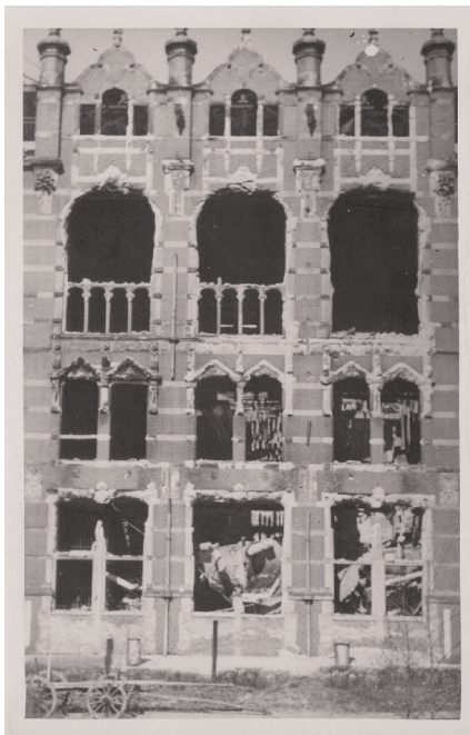
8. Gmach Główny, część centralna elewacji południowej, wiosna 1945 roku