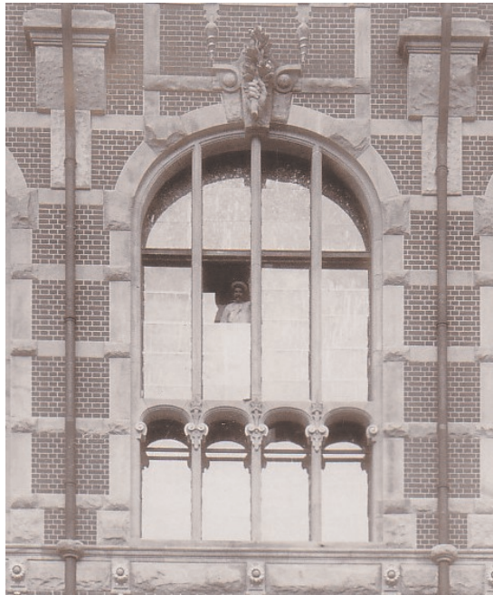
6. Gmach Główny, część centralna elewacji południowej, detal z „portretem” Biblioteka Politechniki Gdańskiej, Sekcja Historyczna; rep. Dariusz Kortas