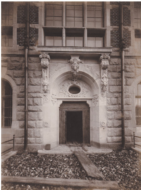
7. Portal w elewacji wschodniej Gmachu Głównego, wiosna 1904 roku