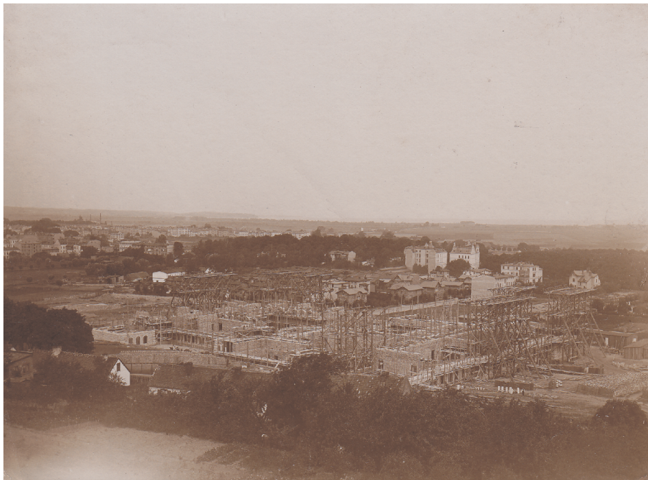
3. Plac budowy gdańskiej uczelni technicznej, wznoszenie parteru, widok z Szubienicznej Góry (Galgenberg) od strony południowo-wschodniej; w tle widoczne zabudowania Górnego Wrzeszcza (Langfuhr), dzisiejsza Aleja Grunwaldzka (Hauptstraße) i Zatoka Gdańska, lato 1901 roku