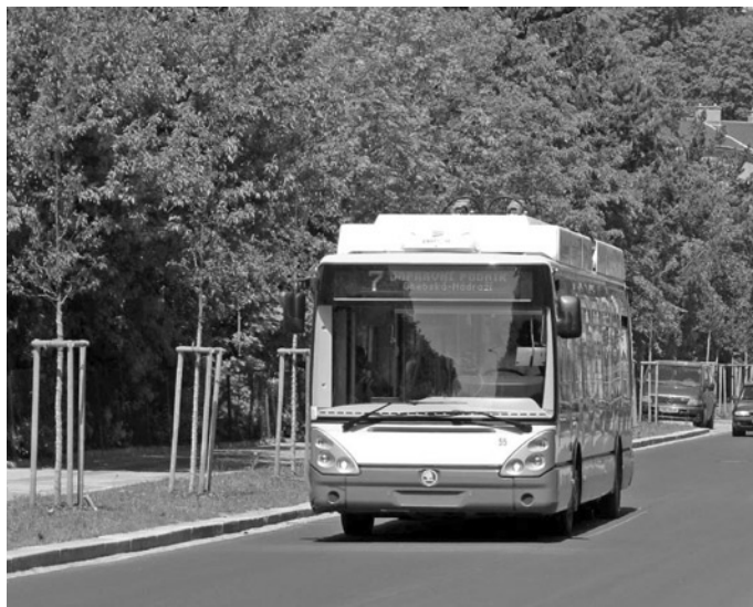
Fot. 9. Škoda 24Tr eksploatowana w ruchu liniowym w czeskich Mariańskich Łaźniach