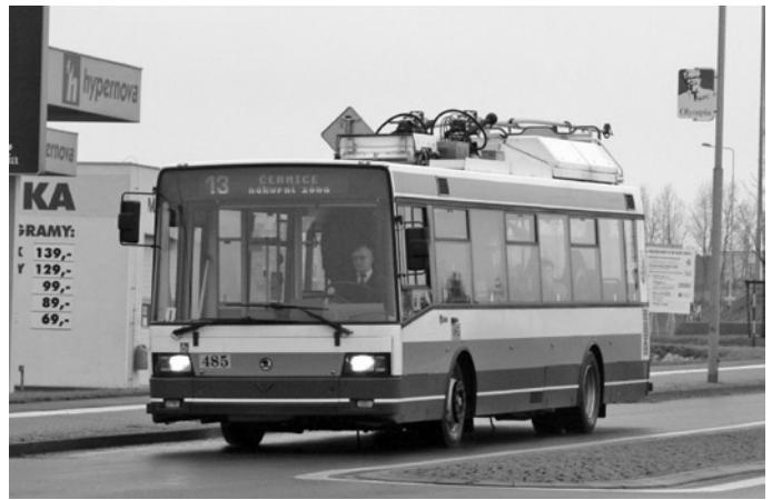
Fot. 1. Škoda 21TrACI w Pilźnie w trakcie przejazdu przy zasilaniu z agregatu spalinowego

Baterie trakcyjne dostępne są w różnych technologiach i zazwyczaj dedykowane każdemu przedsiębiorstwu indywidualnie. W regularnej eksploatacji pozostają w Europie akumulatory ołowiowe, niklowo-wodorkowe, niklowo-kadmowe (fot. 5), a w ostatnich miesiącach rozważa się wprowadzenie do eksploatacji bardzo lekkich litowo-jonowych. Określając zalety baterii, należy jednoznacznie wyznaczyć ich nieemisyjność w odróżnieniu od agregatów spalinowych. Trolejbus korzystający z zasilania bateryjnego pozostaje nadal pojazdem w stu procentach elektrycznym, co jest szczególnie ważne dla przedsiębiorstw eksploatujących łącznie pojazdy korzystające z energii elektrycznej. W przypadku agregatów spalinowych jest uciążliwe w zajęciach niedostosowanych do obsługi pojazdów spalinowych. W przypadku akumulatorów ten aspekt nie występuje, ale i bardziej odczuwalną ich wadą jest ograniczony zasięg.