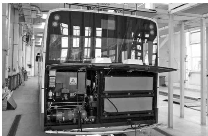
Fot. 5. Dwa moduły baterii nikielowo-kadmowych zabudowanych w trolejbusie Solaris Trollino 12M w Gdyni

Przy zasilaniu z baterii trakcyjnych długość odcinka, jaki może przejechać trolejbus, jest uzależniony od ich pojemności. Pojemność akumulatorów przekłada się na ich masę, a ta przy wielkości porównywalnej z masą agregatu spalinowego o mocy 100kW pozwala na przejazd od 3 do 7 km w zależności od zastosowanej technologii. W przypadku eksploatacji baterii w ruchu awaryjnym (na okoliczność czasowego zamknięcia krótkiego odcinka trasy) lub liniowo przy obsłudze krótkiego odcinka np. wybiegowego, obecnie dostępną pojemność baterii należy uznać za wystarczającą. Zważywszy, że bateria to źródło zasilania „odnawialne” – może zostać doładowana z sieci trakcyjnej przy normalnej pracy trolejbusu, to jej wada w zakresie zasięgu eksploatacji jest pomniejszona względem agregatu spalinowego. Poza aspektem pojemności akumulatorów i ich masy ważna jest także żywotność takiego źródła zasilania. W zależności od wykorzystanej technologii oraz pracy baterii (stopnia ich rozładowania) można oszacować ich żywotność. Z punktu widzenia przewoźnika istotne jest, aby fabrycznie implementowane rozwiązanie posłużyło jak najdłużej.