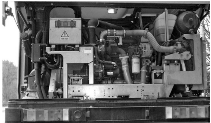
Fot. 2. Agregat spalinowy diesla zamontowany w trolejbusie Škoda 24Tr w przedsiębiorstwie trolejbusowym Zlín-Otrokovice