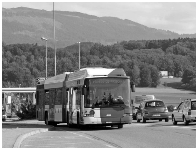
Fot. 10. Trolejbus HESS eksploatowany w ruchu liniowym w szwajcarskim Fribourgu