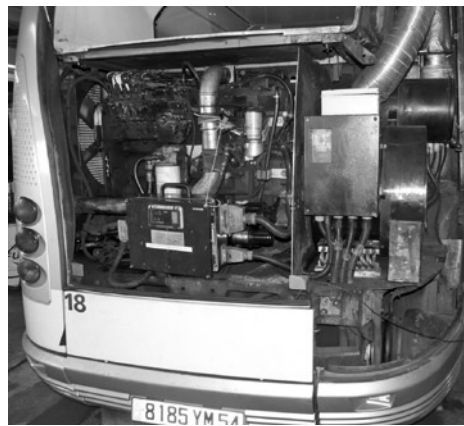
Fot. 3. Agregat spalinowy diesla zamontowany w pojeździe TVR (trolejbus naprowadzany szyną w jezdni), Nancy