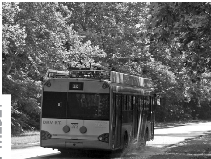
8. Solaris Trollino 12D eksploatowany w ruchu liniowym w węgierskim Debreczynie, Mikołaj Bartłomiejczyk