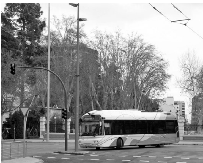
Fot. 7. Trolejbus Irisbus Cristalis zawracający przy zasilaniu z agregatu spalinowego, Castellon