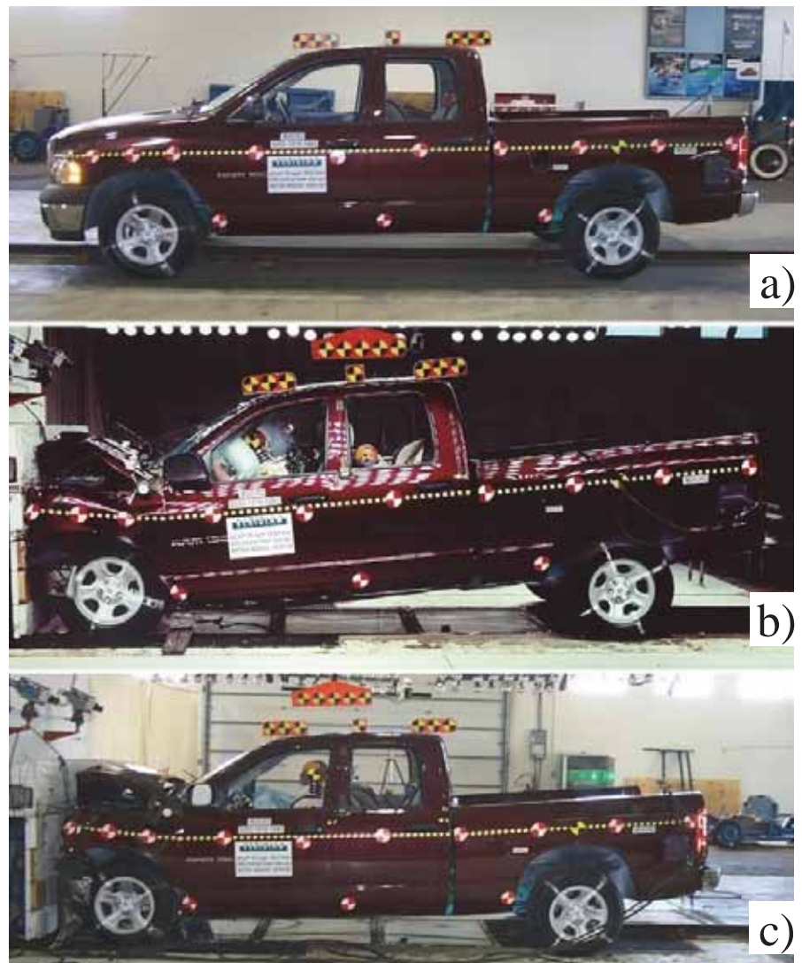
Fot. 3. Samochód: a) przed zderzeniem, b) w trakcie zderzenia, c) po zderzeniu [1]

Dla manekina siedzącego przodem do kierunku jazdy największa wartość opóźnienia wzdłużnego głowy występuje przy 0,08 s ze szczytową wartością przyspieszenia wynoszącą około -56 g (rys. 1, b). Pomiedzy 0,11 s a 0,14 s wartość opóźnienia oscyluje wokół wartości około -15 g. Spowodowane jest to wyhamowującym oddziaływaniem pasów. Drugi pik w czasie 0,21 s wynika z uderzenia głowy dziecka o sztywne oparcie fotelika samochodowego. Ma on wartość 23 g, która jest mniejszą od wartości dopuszczalnej. Część energii kinetycznej manekina została już pochłonięta przez pasy