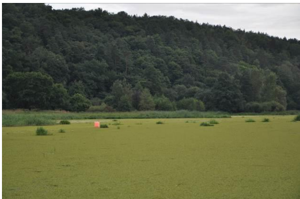
Rys. 5. Rzeka Nogat sierpień 2016 [fot. Jerzyło P.]

łach do około 1,30 m. Sam w sobie problem z punktu żeglugowego stanowi przekop Wiślany. Wisła jest powiązana z portem gdańskim przez służę w Przegalinie, natomiast nie ma jeszcze bezpośrednio połączenia z Portem Północnym, z Zalewem Wiślanym jest natomiast połączona przez służę w Gdańskiej Głowie i rzekę Szkarpawę lub przez Służę w Białej Górze i rzekę Nogat (Rys. 5) [1].