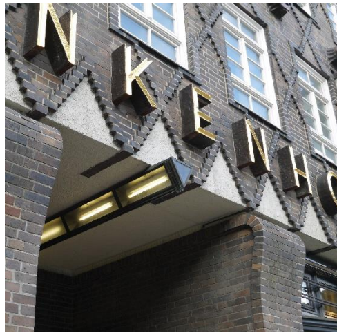
Fot. 1 - F. Hoeger – Chillehaus(1922-24), Hamburg – elewacja