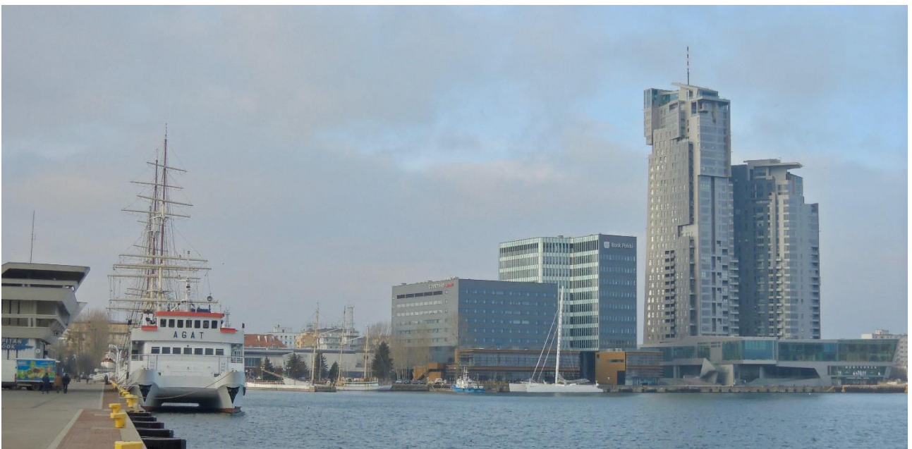
Fot. 12 – widok współczesnego frontu wodnego Gdyni ze Skweru Kościuszki

Gdańsk i Gdynia, mimo, że oba miasta wolne są już od rywalizacji na gruncie polityki narodowej, a także mimo faktu współtworzenia jednego organizmu miejskiego wraz z Sopotem, pozostają jednak w stanie pewnej szczególnej, także wizerunkowej rywalizacji. Portowy charakter Gdyni czytelny jest choćby z faktu obecności jej ścisłego centrum na styku z morzem i basenami portowymi. Władze Gdyni dodatkowo świadomie inwestują obecną w tym mieście od samych jego początków, atmosferę postępu, nowatorstwa i otwarcia na przyszłość. Plany rozwojowe Gdyni skierowane są na zagospodarowywanie uwolnionych terenów na styku z portem, co zaprezentowane jest w budynku Gdynińskiego Infoboxu (podobnie jest w Hamburgu, gdzie plany rozwojowe przedstawione są w ogólnodostępnym, specjalnie zaadaptowanym budynku). Widoczna jest kontynuacja architektury w modernistycznym duchu i skali, co szczególnie dobrze widać w postaci już zrealizowanej wysokościowej zabudowy fragmentu frontu wodnego nabrzeży portowych oraz rozstrzygniętego konkursu na zagospodarowanie tzw. Sea City (ryc.12).