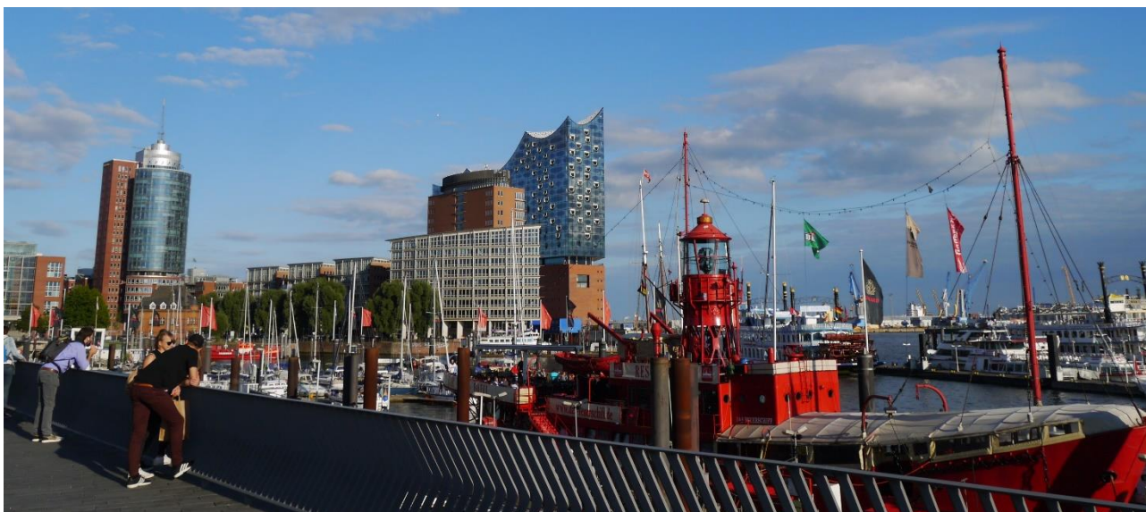
Fot. 10 – widok współczesny Hafencity i portu w Hamburgu

Powyższe porównanie jest obrazem architektonicznej i urbanistycznej przeszłości czterech miast próbujących w dobie żywych przemian okresu Modernizmu zaznaczyć swą tożsamościową odrębność. Dziś wobec znacznego rozrostu i przekształceń ww. miast, przedstawione cechy i różnice nie są już tak czytelne. Rodzi to jednak pytanie o współczesny obraz i tożsamość ww. miast portowych. Altona, bowiem w istocie stała się mieszkalną dzielnicą Hamburga o prestiżowym charakterze, ze względu na duże obszary zielone oraz dostęp do Łaby, której północny brzeg stanowi dziś wspaniały teren rekreacyjny miasta. Hamburg w swym centrum tj. na uwolnionych terenach po dawnym porcie realizuje jedną z najbardziej spektakularnych inwestycji urbanistycznych nie tylko w skali europejskiej, jaką jest Hafencity. Dzielnicą ta staje się nowym centrum Hamburga a władze miasta świadomie dążą do nadania mu czytelnej identyfikacji architektonicznej i urbanistycznej przeprowadzając liczne konkursy architektoniczne. Kończona jest obecnie inwestycja Elbphilharmonie, która staje się nowym symbolem Hamburga (ryc. 10).