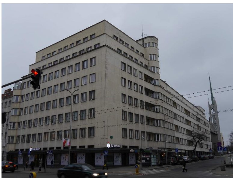
Fot. 8 – R. Piotrkowski – budynek ZUPU, obecnie U.M. Gdyni (1934-36), Gdynia – elewacja od ul. 3 Maja