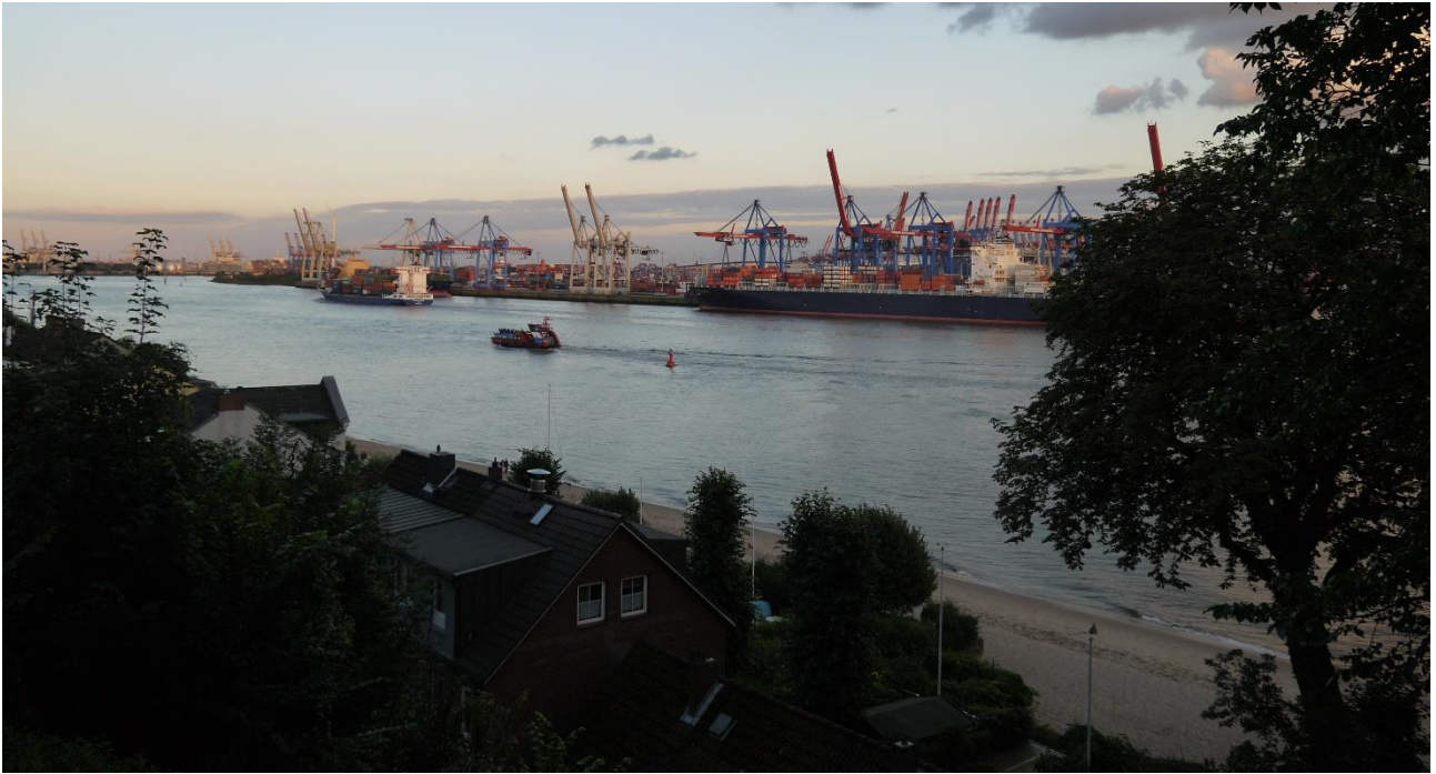
Fot. 11 – widok współczesny terenów nadwodnych Altony oraz portu w Hamburgu (Fot. autor)

Gdańsk i Gdynia, mimo, że oba miasta wolne są już od rywalizacji na gruncie polityki narodowej, a także mimo faktu współtworzenia jednego organizmu miejskiego wraz z Sopotem, pozostają jednak w stanie pewnej szczególnej, także wizerunkowej rywalizacji. Portowy charakter Gdyni czytelny jest choćby z faktu obecności jej ścisłego centrum na styku z morzem i basenami portowymi. Władze Gdyni dodatkowo świadomie inwestują obecną w tym mieście od samych jego początków, atmosferę postępu, nowatorstwa i otwarcia na przyszłość. Plany rozwojowe Gdyni skierowane są na zagospodarowywanie uwolnionych terenów na styku z portem, co zaprezentowane jest w budynku Gdynińskiego Infoboxu (podobnie jest w Hamburgu, gdzie plany rozwojowe przedstawione są w ogólnodostępnym, specjalnie zaadaptowanym budynku). Widoczna jest kontynuacja architektury w modernistycznym duchu i skali, co szczególnie dobrze widać w postaci już zrealizowanej wysokościowej zabudowy fragmentu frontu wodnego nabrzeży portowych oraz rozstrzygniętego konkursu na zagospodarowanie tzw. Sea City (ryc.12).