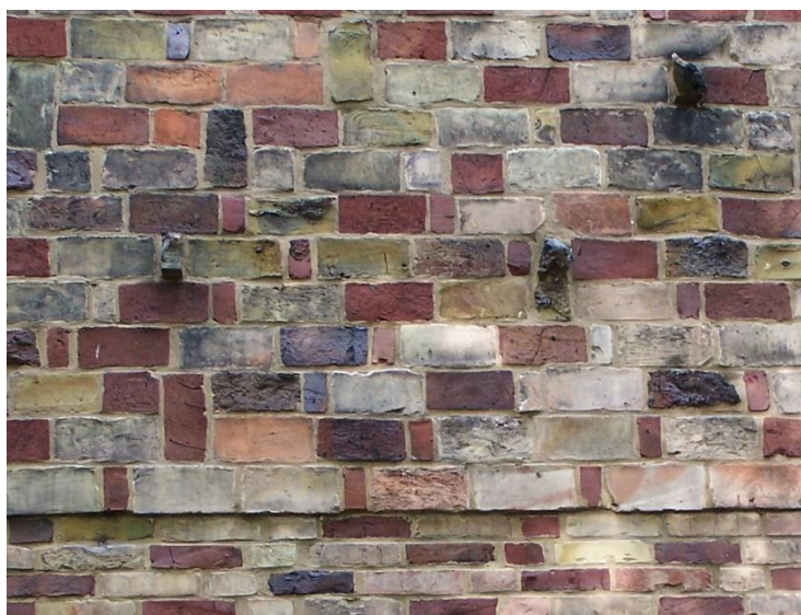
Fot. 4 - G. Oelsner – osiedle przy Helmhotzstrasse i Bunsenstrasse (1927-28), Altona – fragment elewacji klinkierowej Fot. 5 - G. Oelsner – osiedle przy Helmhotzstrasse i Bunsenstrasse (1927-28), Altona – detal elewacji klinkierowej

Architektura proponowana przez Gustawa Oelsnera, architekta miejskiego Altony, mimo pozornych podobieństw takich jak np. użycie tradycyjnego materiału stanowiącego podstawę architektonicznej tożsamości Hamburga, ma swoje silne i unikatowe oblicze. W opozycji też do Hamburga urbanistyka i architektura Altony miała nieść komunikat o potrzebie tworzenia w duchu egalitaryzmu i społecznej odpowiedzialności. Dotyczy to nie tylko architektury obiektów mieszkaniowych, ale też budynków publicznych, czy założeń parków, publicznej zieleni oraz obiektów sportowych.