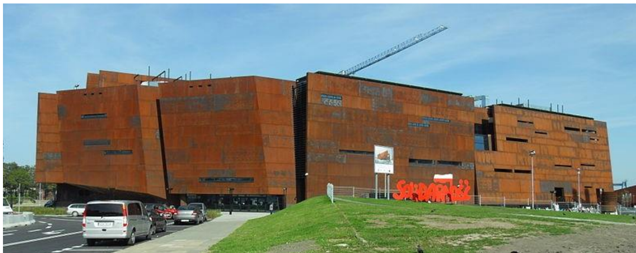
Fot. 13 – arch. W. Targowski – Budynek ECS (2014), Gdańsk

Gdańskie więzi z tradycją portową i stoczniową w jego centralnej części widoczne są jedynie w postaci dźwigów stoczniowych, których byt, mimo że stanowią wspaniały symbol miasta, ciągle jest niepewny. Planowane tzw. Młode Miasto na terenach dawnej stoczni będzie zapewne odpowiedzią na problem tożsamości architektonicznej portowego miasta Gdańska. Dziś jednak tereny postoczniowe, i poprzemysłowe w znacznej części centralnych obszarów Gdańska pozostają niezagospodarowane. Mimo realizacji znakomitych budynków jak Europejskie Centrum Solidarności, czy budynku Muzeum II Wojny Światowej, będących efektem rozstrzygnięć międzynarodowych konkursów i stających się gdańskim symbolem architektury XXI wieku, architektoniczny i urbanistyczny obraz Gdańska jest jeszcze niezdefiniowany (ryc. 13).