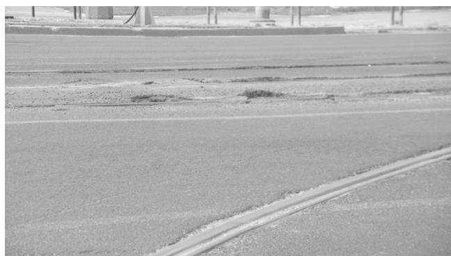
Rys. 11. Wypiętrzania nawierzchni z asfaltu laneo