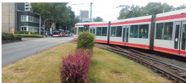
Rys. 5. Wyraźnie wydzielone strefy na przystanku przy linii tramwajowej na Barrandov w Pradze