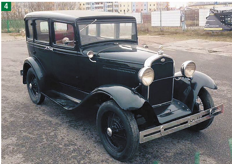
Nieprawidłowości wynikające z wyposażenia pojazdu Ford A z 1928 roku