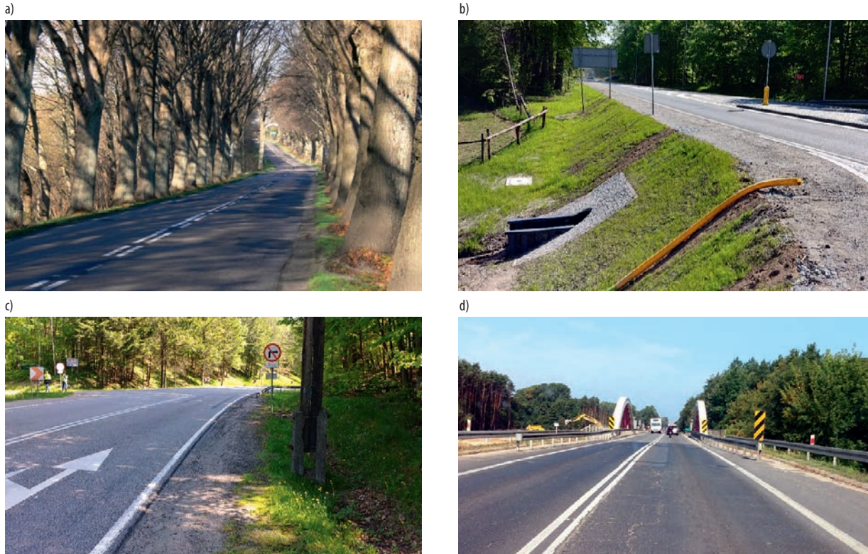
Rys. 3. Przykłady źródeł zagrożeń w otoczeniu drogi

W artykule zaprezentowana została tematyka systemów powstrzymujących pojazd przed wypadnięciem z drogi. Podczas codziennego użytkowania dróg występuje szereg zagrożeń, które wpływają na bezpieczeństwo. Badanie, identyfikacja i klasyfikacja zagrożeń stanowią istotny element utrzymania dróg. Artykuł stanowi drugą część podjętej problematyki. Pierwsza została opublikowana w magazynie Mosty nr 3-4/19 str. 66-68.