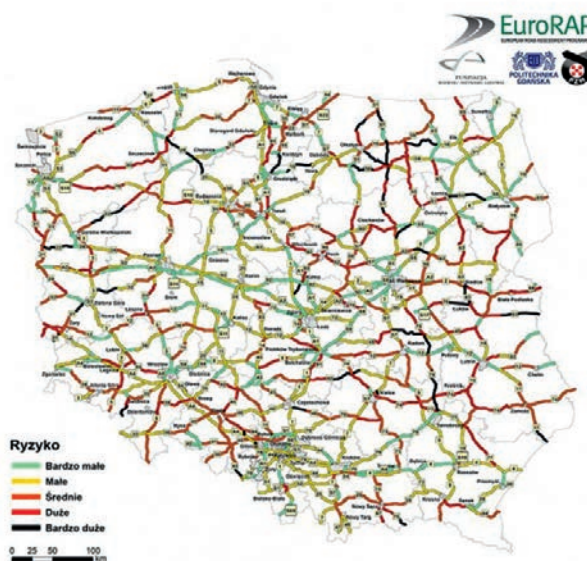
Rys. 4. Mapa ryzyka dla wypadnięć z jezdni

Z uwagi na to oraz na możliwości dostępne w dzisiejszych czasach coraz częściej tego typu testy przeprowadzane są w środowisku wirtualnym, np. w systemie LS-DYNA [15, 16]. Możliwe staje się to z powodu coraz szerszego dostępu do wysokowydajnych jednostek obliczeniowych, które są w stanie bardzo sprawnie rozwiązywać macierzowe układy równań algebraicznych występujące w Metodzie Elementów Skończonych (MES). Symulacje numeryczne z wykorzystaniem MES pozwalają na matematyczny opis zjawisk zachodzących w rzeczywistości. Po prawidłowym przygotowaniu i rozwiązaniu zadania możliwe jest na przykład dokładne przeanalizowanie mechaniki zderzenia, odczytanie sił interesujących z perspektywy projektowania i analizy działania systemu, a następnie przetestowanie opracowanego na tej podstawie prototypu. Badać można również istniejące już rozwiązania dla przypadków, które nie zostały wcześniej przewidziane bądź sprawdzone. Kolejnym atutem wykorzystywania metod numerycznych jest możliwość optymalizacji projektowanych konstrukcji, na przykład redukcja masy wykorzystanego materiału przy zachowaniu funkcjonalności systemu.